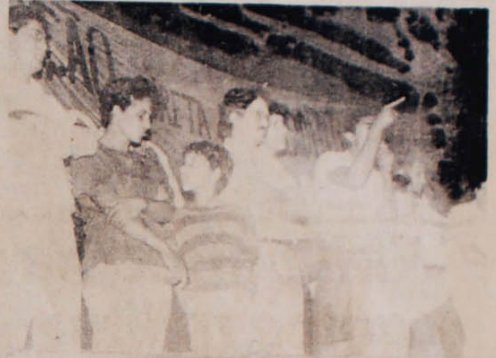
Jardim Nova Esperança, Goiânia: os moradores do bairro entram na campanha