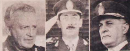
Galtieri, Videla e Viola vão a julgamento por matarem opositores.

Os corpos de mais de 200 presos políticos já foram encontrados em diversos cemitérios clandestinos. E, por seu lado, a Aliança Anticomunista Argentina e o Comando de Luta Antiterrorista Nacional ameaçaram matar os juizes que processam os militares e já realizaram atentados terroristas. Só a pressão das forças democráticas e progressistas pode assegurar a punição dos criminosos a serviço da ditadura militar, para que tais crimes não voltem a acontecer.