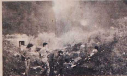
Palestinos devem estar unidos na luta por seus direitos.

do de magnatas. Localizada no Norte da África, a Tunísia tem 6,5 milhões de habitantes, mais da metade dos quais vive nas cidades. O país é dirigido pelo ditador Habib Burguliba, que se declarou presidente vitalício do país em 1975. Ele está no poder desde 1957. Agora, o primeiro-ministro Mohamed Mzali decretou o toque de recolher, a partir das 18 horas, e o Exército ocupou os principais pontos do país. A revolta popular contra os aumentos extorsivos do preço do pão (recomendados pelo FMI) teve início na última semana de dezembro. E, após o Estado de Exceção, decretado na terça-feira, estão proibidas as reuniões de mais de três pessoas nas ruas das cidades.