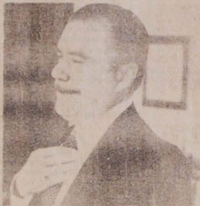
Sarney quer colar os cacus do PDS

A Nação não suporta mais a tutela dos generais. E mesmo dentro do PDS as disputas são de tal envergadura, que a rebeldia vai rompendo com o sistema de obediência incondicional até agora imperante. Todos os presidenciais juraram submissão a Figueiredo, mas na prática cada um tratou de sua candidatura sem nenhuma atenção ao tal coordenador de opereta.