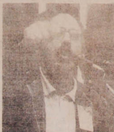
Aldo: um político que faz o que diz.

Natural da cidade goiana de Anápolis, Aldo Arantes projetou-se como figura política de expressão nacional ao exercer a Presidência da União Nacional dos Estudantes, no início dos anos 60, numa gestão considerada até hoje