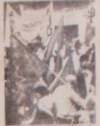
Militantes do PC da Alemanha pode ser detida com apelos e concessões, como defendem os partidos social-democratas e revisionistas. Isto só pode ser realizado através da luta sem compromissos pelos interesses dos operários e dos povos oprimidos do mundo".

Em sua mensagem ao movimento comunista internacional o KPD acentua: "A caminhada dos imperialistas para a catástrofe não