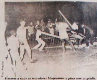
Durante a noite os moradores bloquearam a pista com os gradis.

Não é atoa que o militar refer-se à sua "experiência" e "adestramento" adquiridos nos porões da ditadura. O Escândalo da Mandioca — até hoje não apurado e com seus participantes impunemente — e tantos outros escândalos, como os da Delfin, Coroa-Brastel, Polonetas, Embaixada dos 10% etc. etc., são frutos do regime de arbitrio, impunidade e corrupção instaurado pelos militares em nosso país desde 1964. Não é por acaso, também, que o major dos Anjos imediatamente aponta como alvo de suas ameaças os comunistas. Afinal, foi sob a alegação de "combate ao comunismo" que foram realizados os maiores crimes contra a humanidade em nosso país. Ferreira reza pela cartilha dos militares golpistas, e é nela que colhe argumentos para seus pronunciamentos públicos. E é no seio dos golpistas, também, que busca o refúgio da impunidade aos crimes que cometeu.