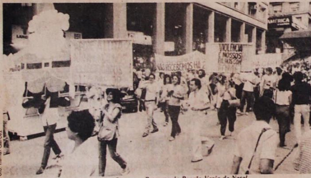
No dia 23 de dezembro, os grevistas fizeram a Passeata da Panela Vazia de Natal.