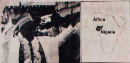
Shagari, deposto a mando do FMI que forçou a expulsão de emigrantes em 1983.