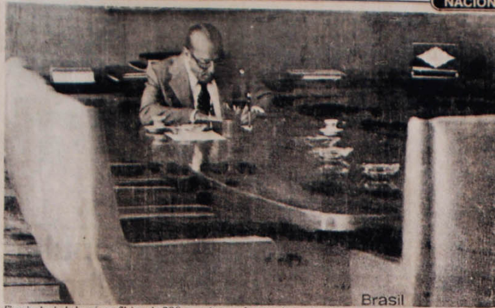
Figueiredo, isolado até nas fileiras do PDS, reconheceu o fracasso da coordenação.