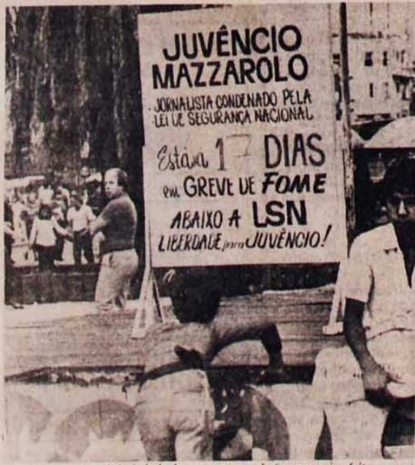
Campanha de solidariedade durante a greve de fome: saiuu efeito