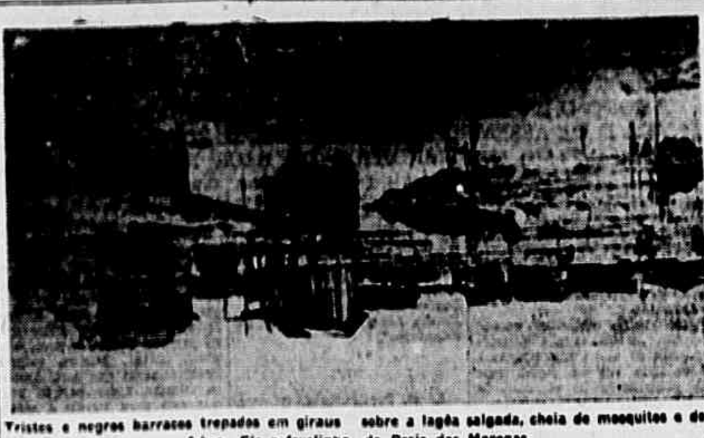
Tristes e negros barracos trepados em giraus sobre a lagoa salgada, cheia de mosquitos e de febre. Eis a favelinha da Praia das Morenas.