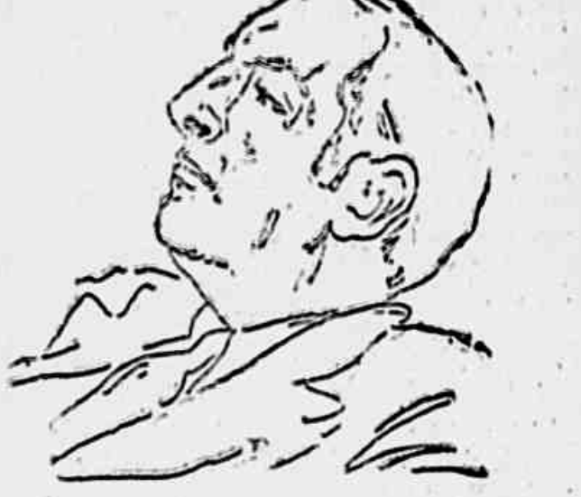
Pablo Neruda, o grande cantor do povo chileno

A situação econômica do país está na borda da catástrofe. Em troca da perseguição aos operários, as empresas imperialistas estrangeiras facilitam secretamente a Videla o dinheiro para