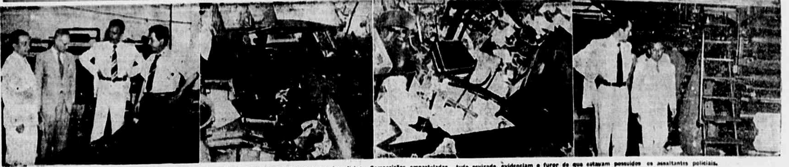
Aspectos colhidos ontem em nossas oficinas, na ocasião da visita de parlamentares e jornalistas. Composições empasteladas, tudo revirado, evidenciam o furor de que estavam possuídos os assaltantes policiais.

SOB UM CLIMA DE INTRANQUILIDADE, PELO QUAL É RESPONSÁVEL O DITADOR DUTRA E SEU GRUPO FASCISTA, TRANSCORRE HOJE O SEGUNDO ANIVERSÁRIO DAS ELEIÇÕES A CONSTITUINTE