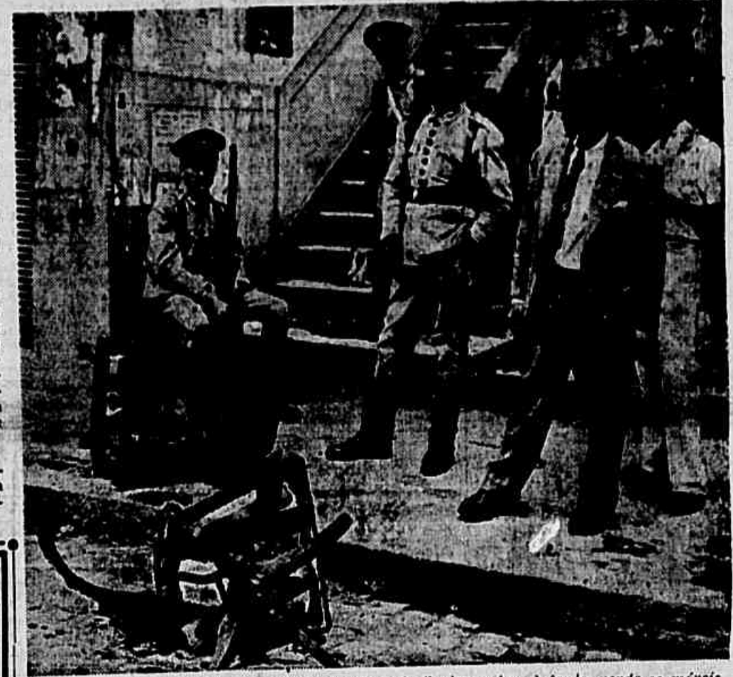
Aspecto tomado em frente ao edifício do fóro de Caxias, ontem à tarde, vendo-se móveis incendiados pelos assassinos

A cidade de Duque de Caxias, igual não se havia verificado ainda, em nenhuma parte do país. Um numeroso grupo de indivíduos assaltou o Foro local, onde se encontravam guardadas as urnas daquele município e do vizinho município de Vila Meriti, tentando incendiar