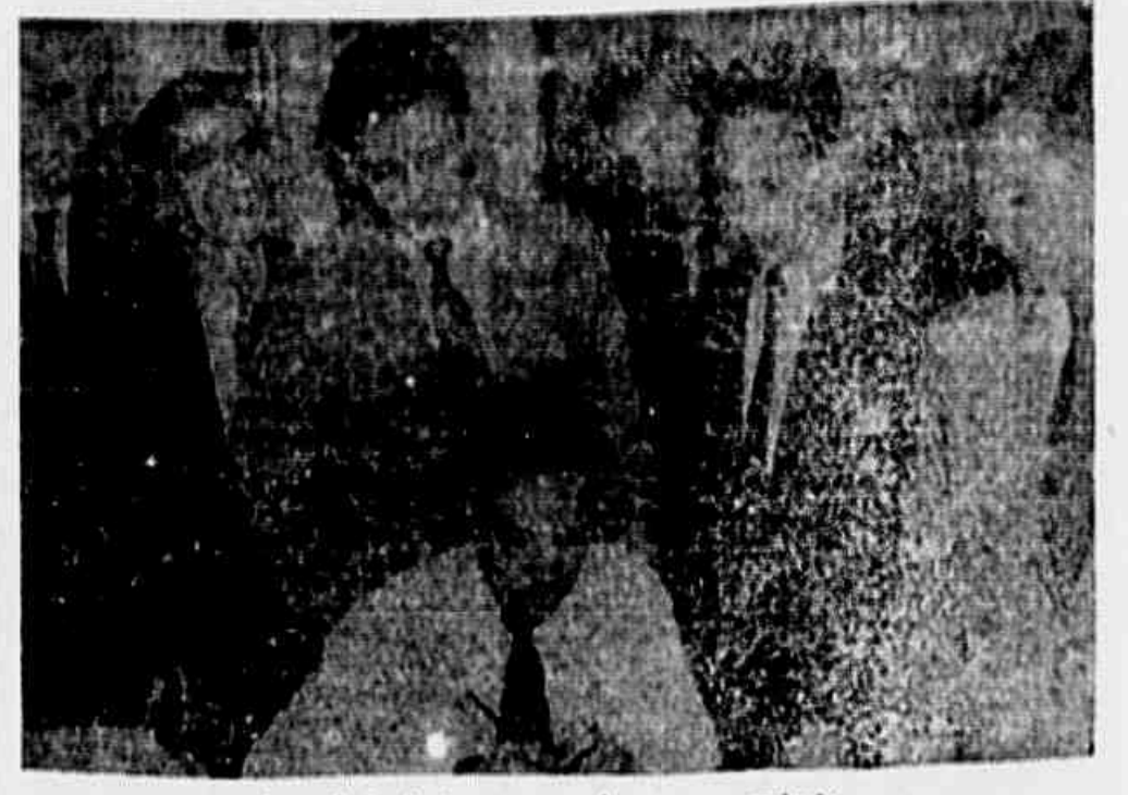
A comissão de jovens quando em nossa redação

peço, e que termina assim: "Esta é a V. Excia. de quem está prestando um grande serviço à democracia em nossa Pátria e em todo o mundo. O povo espera que os deputados cumpram com o seu dever de patriotas."