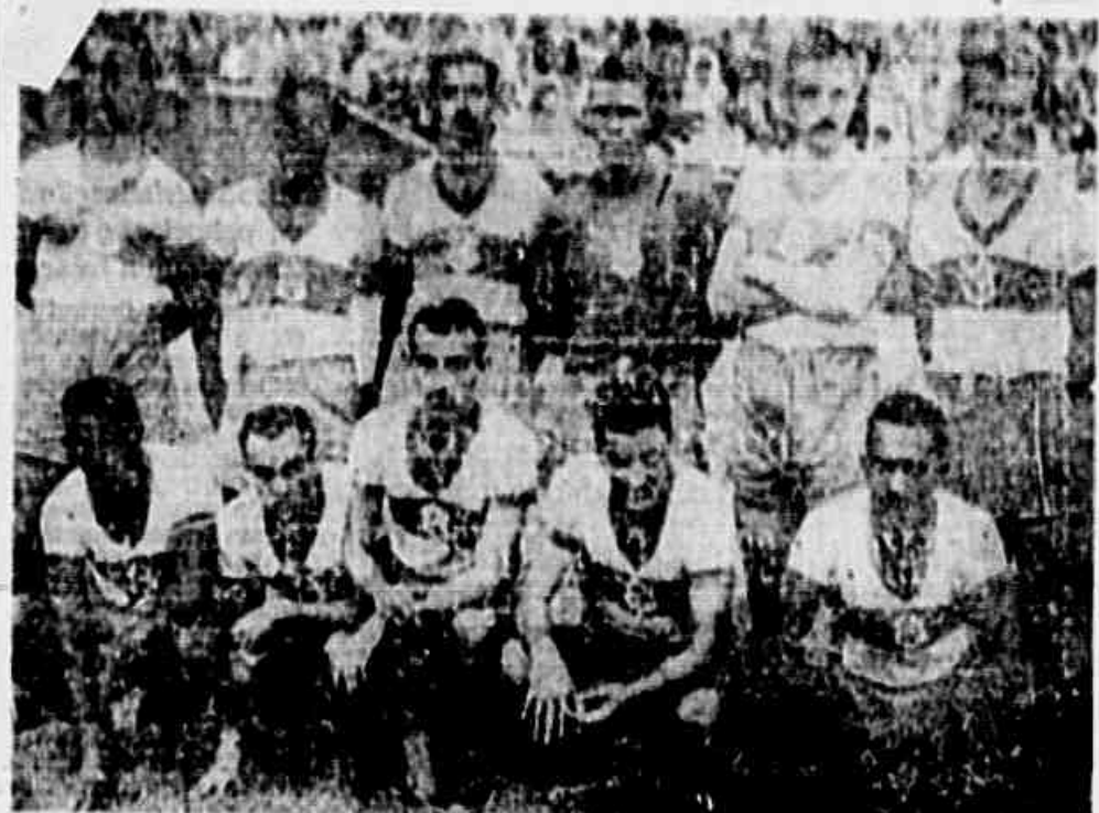
CONFIRMOU O CARTAZ - O Olaria, a maior surpresa do campeonato deste ano, repetiu contra o Fluminense as grandes atuações frente a Flamengo, Botafogo e Vasco que lhe deram fama e carisma. O mais novo concorrente do certame carioca, sem alarde conseguiu reunir onze jogadores valorosos e dedicados e vem atuando da forma a mais acertada, lutando de igual para igual com os mais experientes competidores no título máximo. Domingo contra o Flamengo e Olaria teve o mérito de conseguir igualar uma peleja que lhe era adversa, tornando-se credor da admiração de toda a torcida que asperitou o estádio da rua Bariri. Foi um grande quadro, igual ao dos tricolores.

TUDO PELA VITÓRIA. Pelo exposto verifica-se a importância que terá a peleja na marcha do certame. Peleja chave para os dois, quer por colocar frente a frente os atuais melhores conjuntos da cidade, quer pelo fato dos adversários encontrarem-se invictos na liderança do match Flamengo e Botafogo e o assunto dominante da semana esportiva. Não há favoritos. Duas forças iguais numa batalha que levará ao estádio rubro-negro uma grande multidão capaz de bater todos os recordes de renda até agora obtidos no certame deste ano.