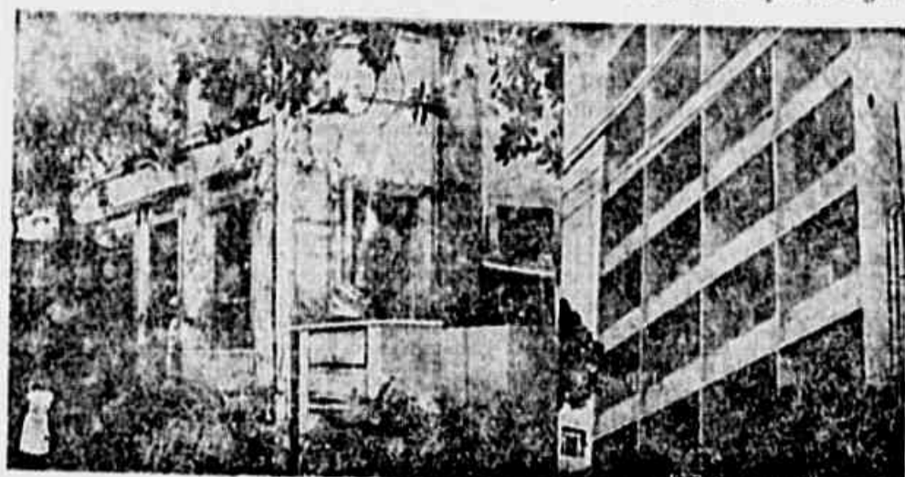
A crise de habitação atinge o inconcebível. Não há onde morar nas a Prefeitura distre favelas e edifícios novos são considerados intactos

Dezenas de cartas nos chegam reclamando contra o desabrigo — Em contraste com a situação dos desabrigados, milhares de apartamentos estão vazios — O nascimento das favelas e o aumento da população nos morros são prova s da crise que se agrava dia a dia