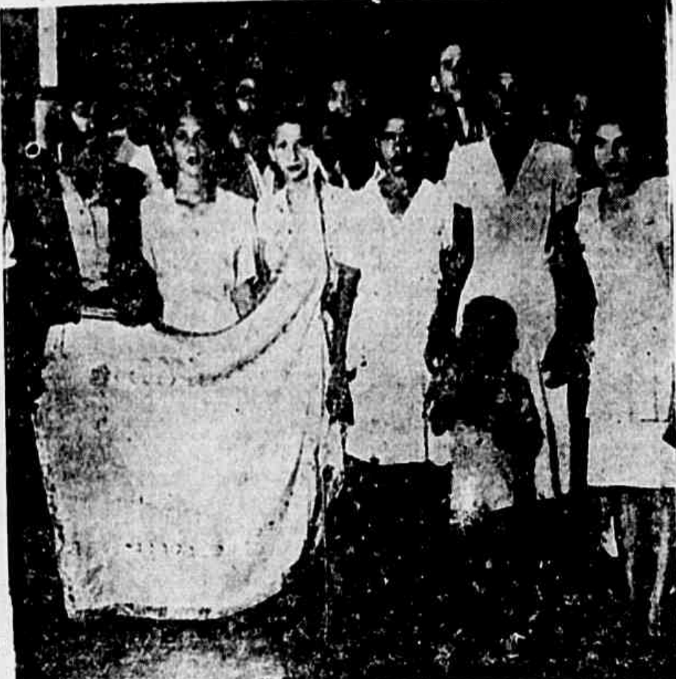
A Escola "Paraíso das Morenas" da morro de São Carlos

"PARAISO DAS MORENAS" DÁ O PRIMEIRO GRITO DE CARNAVAL Presentes à festa de domingo vereadores e representantes da U.G.E.S. e co-irmãos — O morro de S. Carlos homenageou a Câmara Municipal