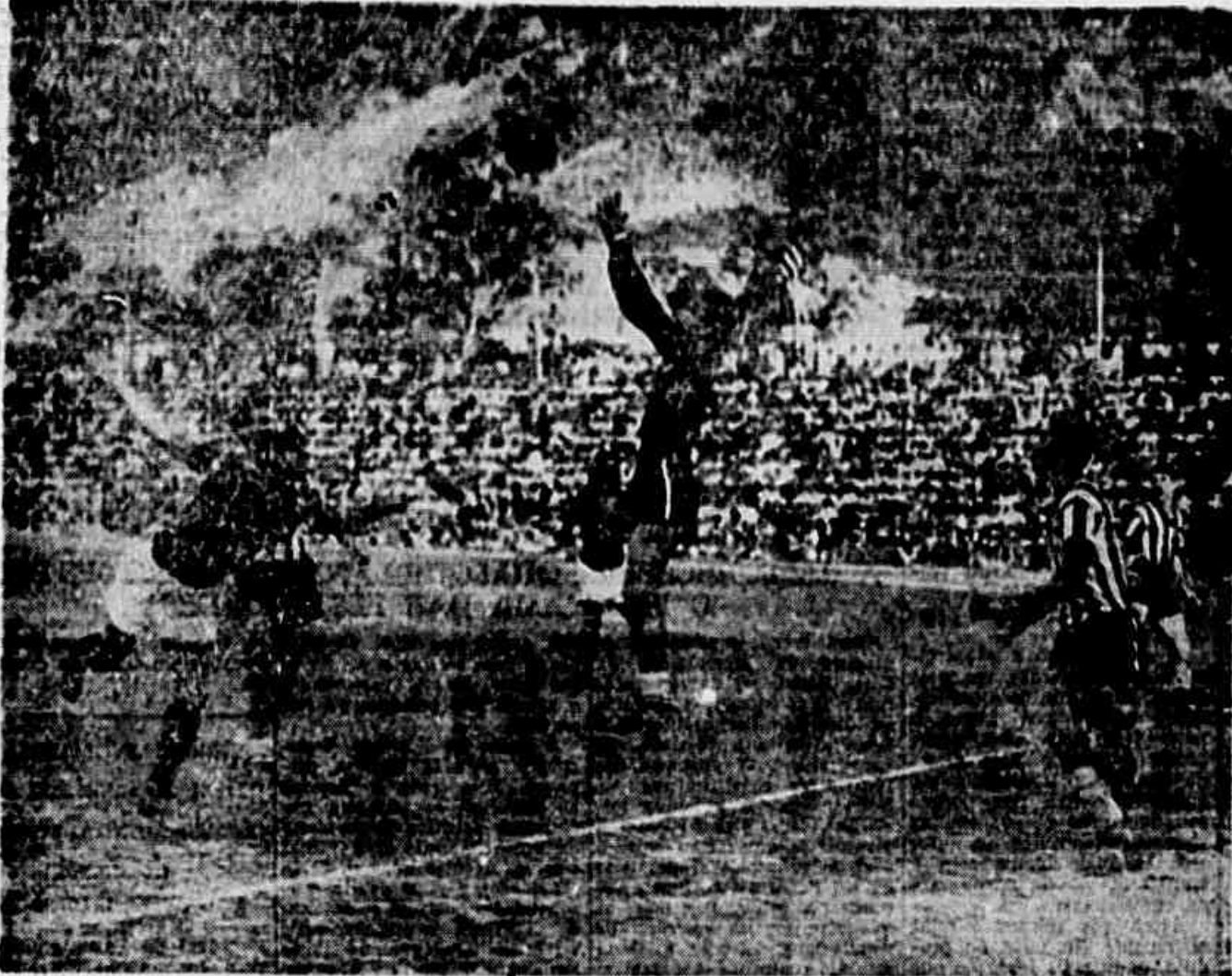
Fase de um encontro entre botafoguenses e rubro-negros. Domingo a cidade assistiu ao grande choque entre os dois clubes, ambos invictos, na liderança da tabela.

FLAMENGO E BOTAFOGO NA MAIS SENSACIONAL PELEJA DO TURNO - EM CHOQUE A LIDERANCA - EMPENHADOS OS DOIS QUADROS PARA UMA GRANDE EXIBICAO