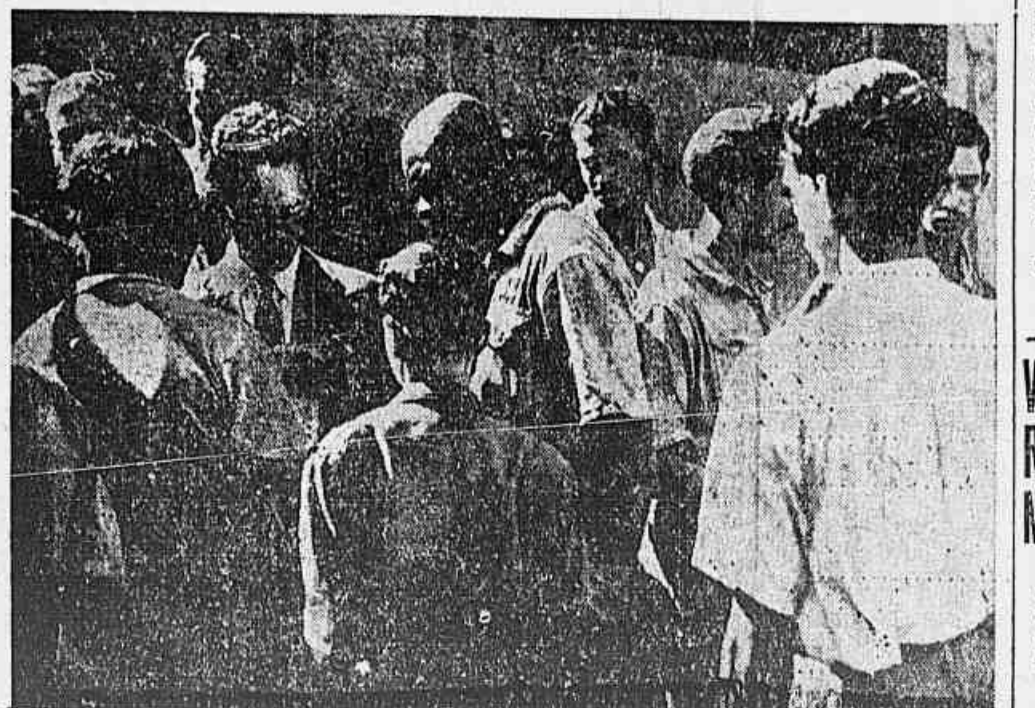
A reportagem-comando da TRIBUNA POPULAR, prosseguindo em seu programa de informar-se nos próprios locais de trabalho, das necessidades e das reivindicações dos trabalhadores cariocas, esteve ontem na porta da fábrica Luporini, durante a hora do almoço, colhendo entre os metalúrgicos que ali trabalham os dados que ora apresentamos. A gravura acima fixa um aspecto de nossa visita àquela empresa. - (Reportagem na 6.ª página)

Em declarações escritas, Dinnyes afirmou que o governo húngaro mantém a decisão invariável de conservar relações estreitas com todas as grandes potências democráticas - os Estados Unidos, a Grã-Bretanha e principalmente a União Soviética. "Ninguém pode pri-