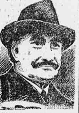
Dimitroff, criador da frente patriótica, líder querido do povo Búlgaro