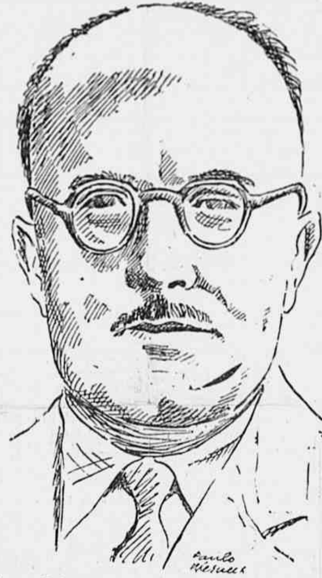
Jacques Duclos, presidente em exercício da Assembleia Francesa e secretário do Partido Comunista

para proporcionar a 48 milhões de contribuintes redução do imposto de renda de 10 a 20 por cento, e o segundo versa sobre o controle do movimento trabalhista.