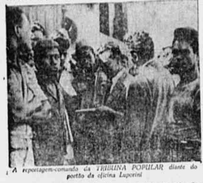
A reportagem-comando da TRIBUNA POPULAR diante do portão da fábrica Luporini

— Sabemos que muitos patrões atravessam dificuldades, por causa da incapacidade de governar dos homens que estão no poder. Mas essas dificuldades não devem recair todas sobre as costas dos operários. Queremos aproveitar esta ocasião para protestar contra o fechamento do PCB, da CTB, da USTDF e contra a intervenção em nosso sindicato. O Governo com isso não resolve os problemas do povo; só faz complicar mais ainda. Como trabalhadores conscientes, dizemos ao general Dutra que queremos um governo democrático, de confiança do povo, e se a ele não interessa um governo assim, que deixe o poder, para felicidade de nossas famílias e para o progresso do Brasil. Nesse momento, tocou a sirene e os operários, despedindo-se efusivamente de nossa reportagem-comando, regressaram ao trabalho.