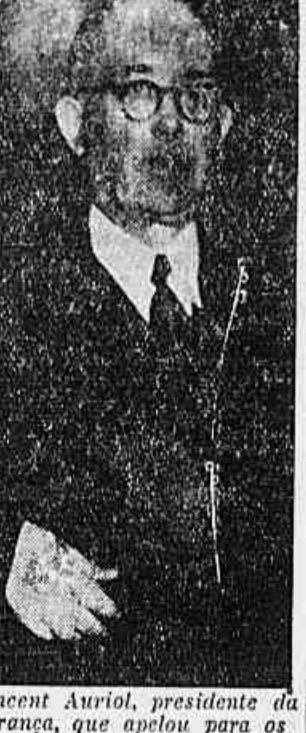
Vincent Auriol, presidente da França, que apelou para os comunistas