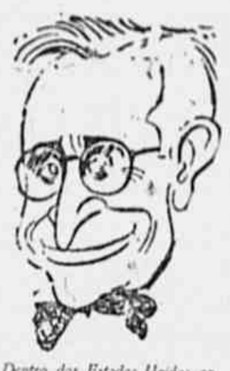
Dentro dos Estados Unidos começam a ser impostas as primeiras derrotas à Truman