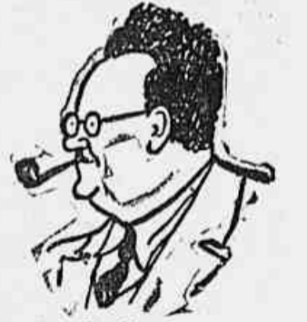
Benoit Frachon, secretário geral da poderosa CGT

As filiais do Partido Popular Republicano. Em Paris, centenas de milhares de operários viram-se impossibilitados de acorrer aos seus empregos devido à greve.