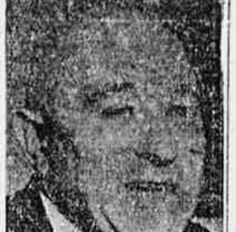
Mattias Rokosi, líder comunista húngaro

BUDAPEST, 7 (De Ruth Lloyd, correspondente da United Press) - O novo primeiro ministro húngaro, Lajos Dinnyes, em entrevista concedida aos jornalistas estrangeiros e respondendo a uma pergunta formulada pela United Press, sobre qual seria a atitude húngara se o caso deste país for submetido às Nações Unidas, declarou: "O governo não guarda nenhum segredo e, portanto responderá a qualquer pergunta da ONU".