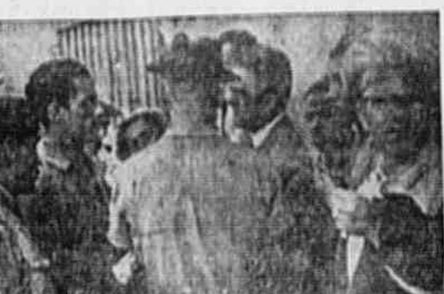
Flagrante da nossa reportagem-comando em contacto com os trabalhadores