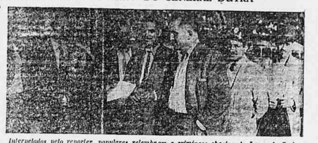
Interpelados pelo repórter, populares relembram a críminosa chacina do Largo da Carioca, evidenciando o desejo de Alcio Couto, Pereira Lira e Imbassay em assassinar o povo, e, assim, criar clima para as suas desordens e conseqüente marcha para a ditadura, em que hoje nos encontramos.

rua da Relação dispararam toda a carga das suas armas contra mulheres, crianças e homens indefesos e indefesas. E como se não bastasse, os soldados tirados a serviço do grupo fascista do ditador Dutra espumaram barbaramente o povo, ululando de gozo com uma festa nazista. Naquela época, o ditador e os fascistas do seu governo davam as suas primeiras e violentas reações contra a Constituição e a Democracia. A transferência à última hora, pela polícia de Lira e Imbassay, de um comício do Partido Comunista para a Praça Nossa Senhora da Paz, em Ipanema, quando o mesmo estava programado para o Largo da Ca-