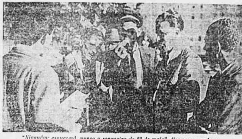
"Ninguém esquecerá nunca a sangreira do 23 de maio", dizem os populares

PENETRAM EM CHANGCHUN OS COMUNISTAS NANKIN, 22 (A.P.) - Notícias de fonte nacionalista dizem que os guerrilheiros comunistas estão realizando incursões sobre Changchun, enquanto soldados comunistas uniformizados irrompem em Changchun e atacaram estações de polícia da capital mandchua. O governo anunciou haver mandado "uma força considerável" de aviões para a Manchúria, para aliviar o cerco de Changchun.