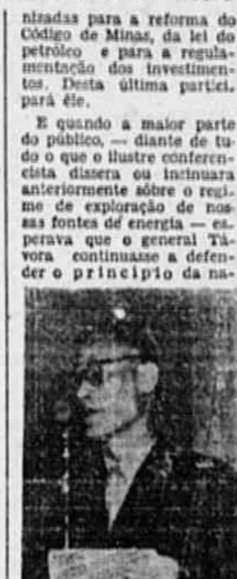
General Juarez Távora