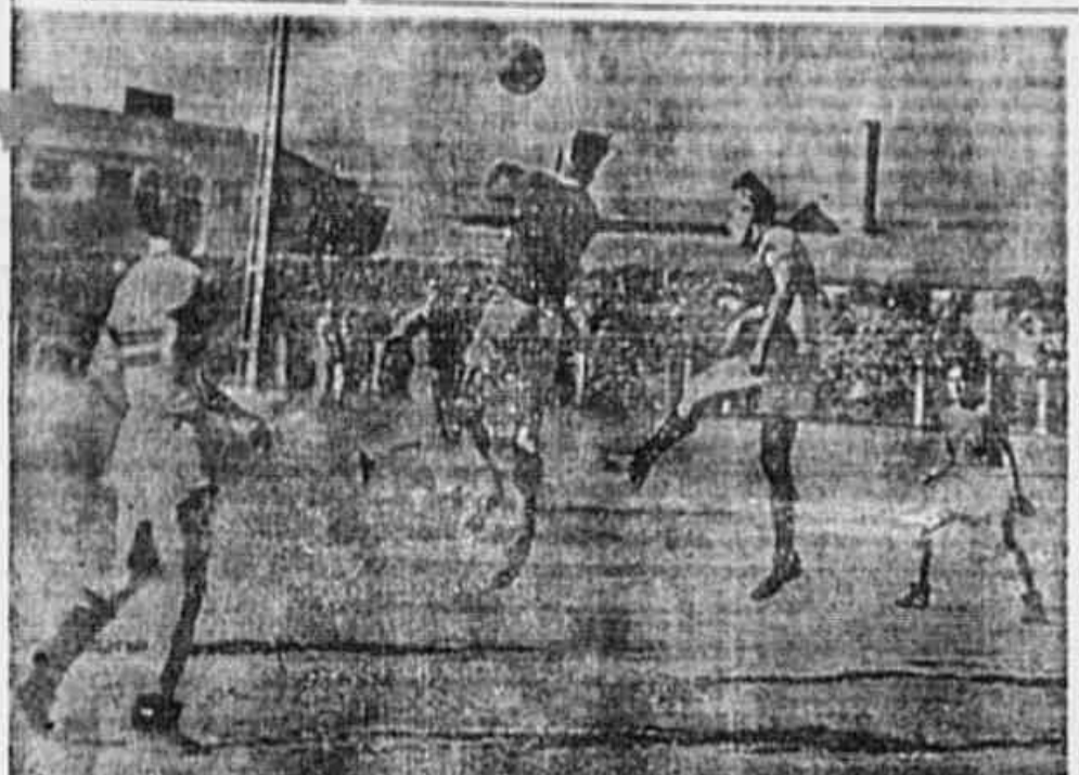
EM AÇÃO A DEFESA DO SENHOR DOS PASSOS — Na festa de domingo último, o Senhor dos Passos pelou com muito ardor com o Sudan A. C. A defesa do valoroso grêmio da zona Centro trabalhou bastante para conter os driblantes adversários. A gravação acima, mostra a defesa do Senhor dos Passos em ação, evitando uma carga dos driblantes de Sudan.