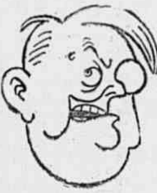
Giannini, o líder fascista italiano, excelente servil para Truman