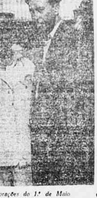
Operários da Light falam de seu entusiasmo pelas comemorações do 1.º de Maio

Estranha «neutralidade» de autoridades brasileiras de Ponta Porã, em desacordo com a orientação do Itamarati — Intranquilidade entre a população fronteiriça