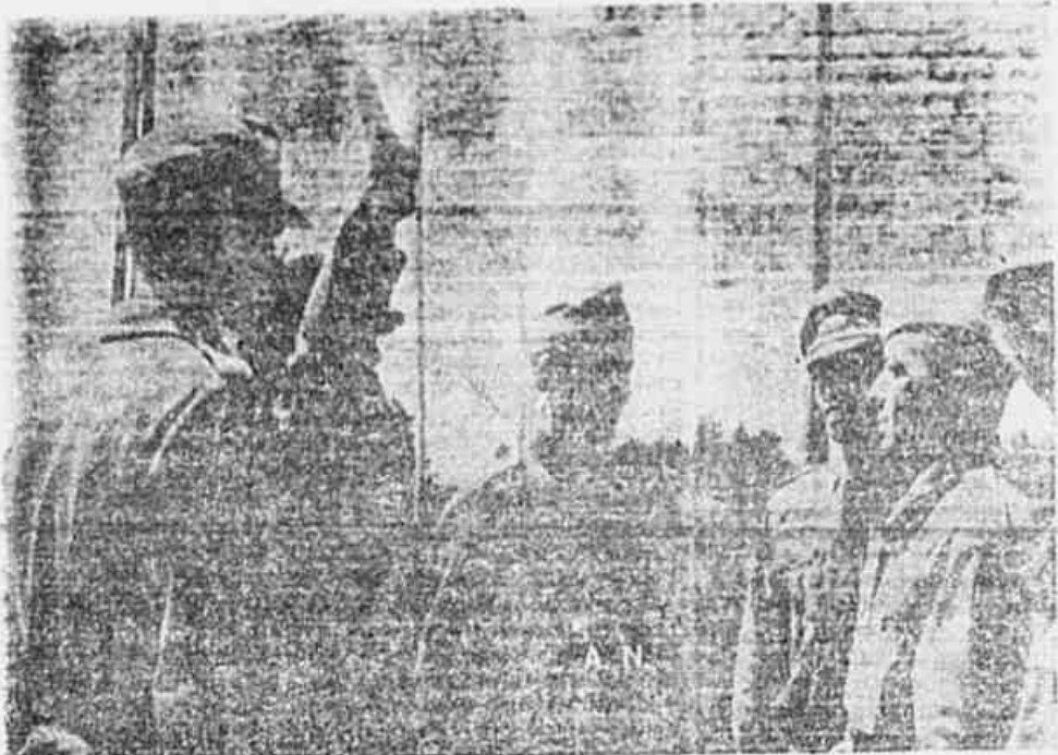
Fotografia histórica do instante em que o Alto Comando da divisão nazista se apresentava aos oficiais da F.E.B. para negociar a rendição

UNIDADE DEMOCRACIA PROGRESSO ANO II N.º 586 TERÇA-FEIRA, 29 DE ABRIL DE 1947