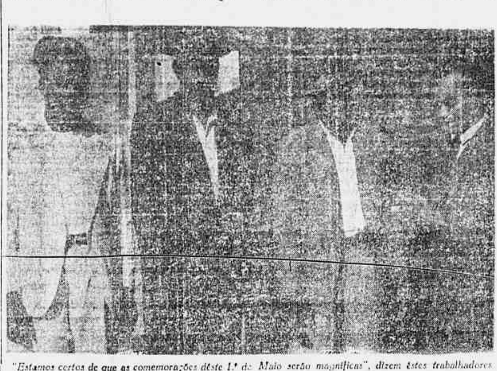
«Estamos certos de que as comemorações deste 1.º de Maio serão magníficas», dizem estes trabalhadores.