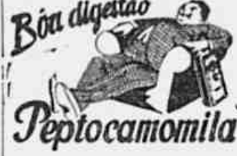
Boa digestão Peptocamomila