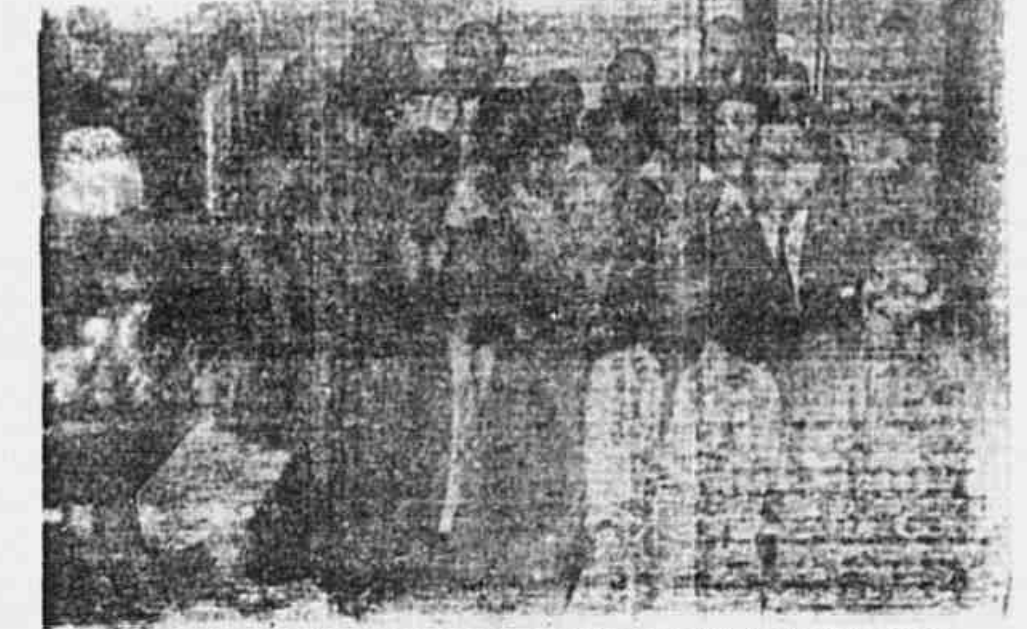
Os delegados da Célula Pedro Ernesto quando realizaram a sua Conferência

cipalmente no Clube Municipal, sempre sendo que existam essas organizações, a maior atenção do funcionalismo deve estar voltada para a sua unidade, pois só assim, com a sua federalização, será possível redigir e levar à prática a luta pela consagração democrática em novos pais.