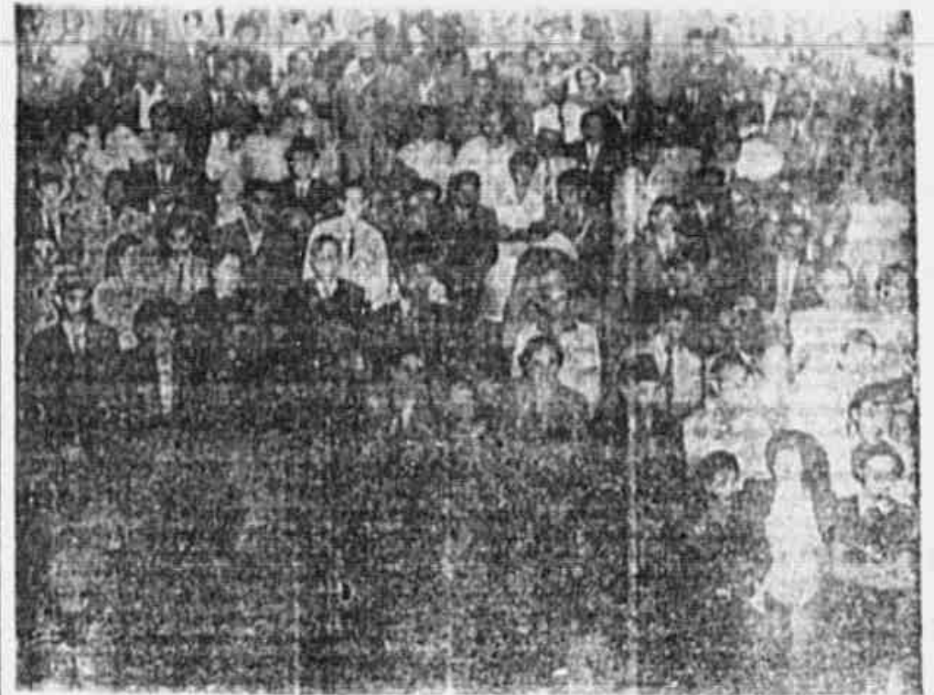
Aspecto de grande massa popular presente ao encerramento da conferência do C. D. de São Cristóvão

Aos militantes e amigos do P. C. B. Pede-se a quem se der de uma casa para alugar, com jardim em volta e não distante do Centro da cidade. Informar na portaria deste jornal tel. 22-3070.