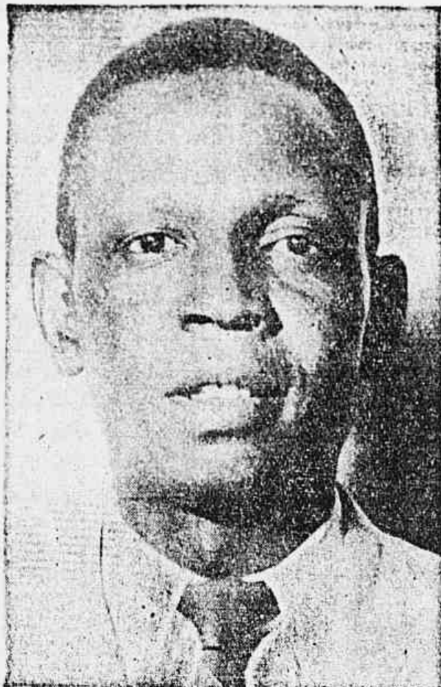
Ataulfo Alves, o grande sambista brasileiro.

Ataulfo diz-nos em seguida: — "Piquei muitíssimo satisfeito em saber que a TRIBUNA POPULAR está patrocinando o Carnaval da Paz de 1947. Como sambista reconheço que os meus irmãos dos morros, com a sua vitalidade de artistas, com o seu patriotismo, são os que estão fazendo o nosso carnaval. Esta festa é um patrimônio do nosso