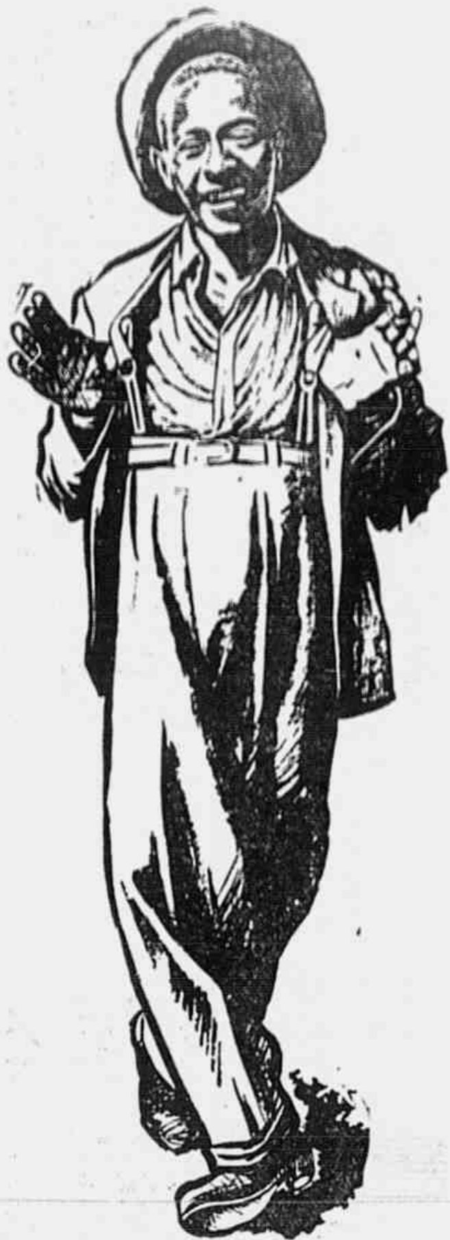
"Cavuca", o eleito "Cidadão Samba"