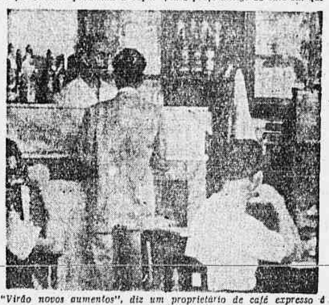
"Virão novos aumentos", diz um proprietário de café expresso á reportagem da TRIBUNA POPULAR

Implicar o pessoal ferroviário nos desastres que ultimamente vêm ocorrendo naquela companhia de transporte, em virtude da circulação de trens clandestinos. Para se poder avaliar a situação em que se encontram esses trabalhadores, na atual emergência, em face do delegado de polícia daquela localidade, um sr. Vieira, basta citar estas palavras que lhe saíram espontaneamente da boca: — O povo brasileiro é muito (CONCLUI NA 2ª PAG.)