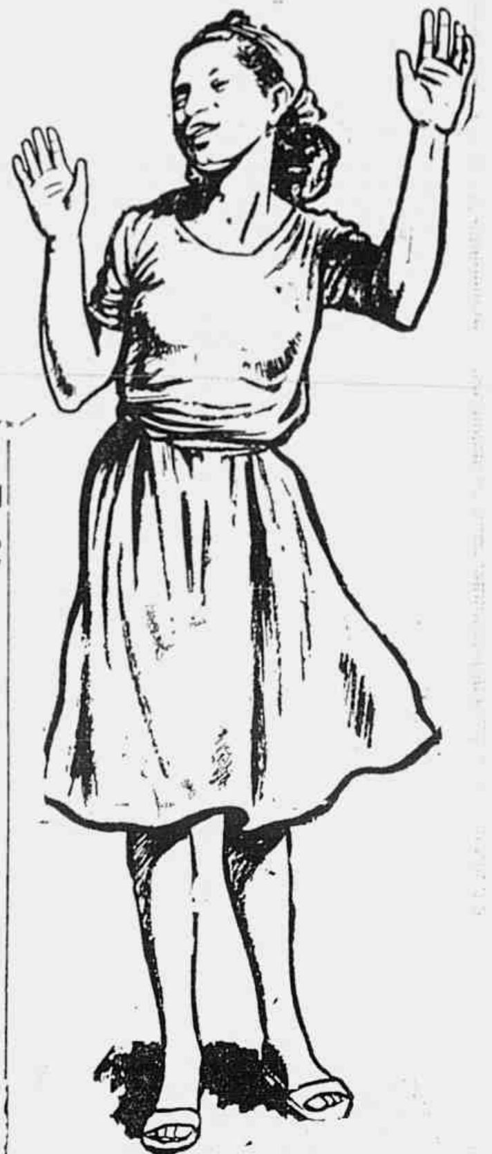
"Moreninha", a eleita "Embaixatriz do Samba"

Logo mais, portanto, o Rio assistirá ao espetáculo que mais o apaixonou, a maior de suas festas de rua, o desfile dos milhares de músicos e bailarinos de samba.