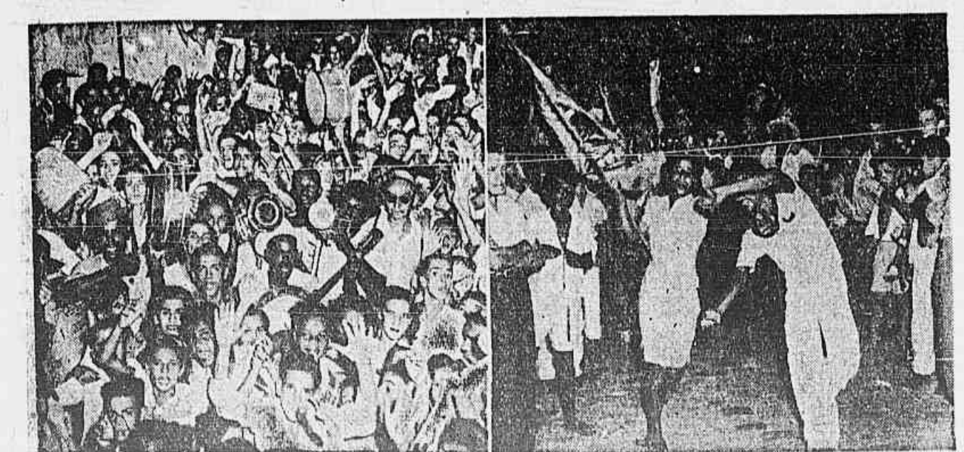
A formidável batalha de ontem à noite, nas ruas que confluem para o Largo do Estácio, dá bem uma idéia dos entusiasmos com que os mortos se prepara para o grande desfile do Campo de São Cristovão, quando se empossarão solenemente "Canuca", "Moreninha", os célticos "Cidadão" e "Embaixatriz" do Samba no concurso promovido pela TRIBUNA POPULAR.