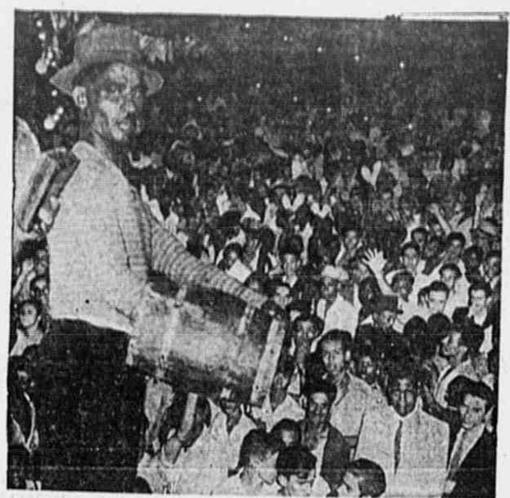
As blocos "Unidos da Paz" e "Unidos de São Cristóvão" foram o destaque da noite. O bloco "Unidos da Paz" foi o vencedor da taça de ouro.