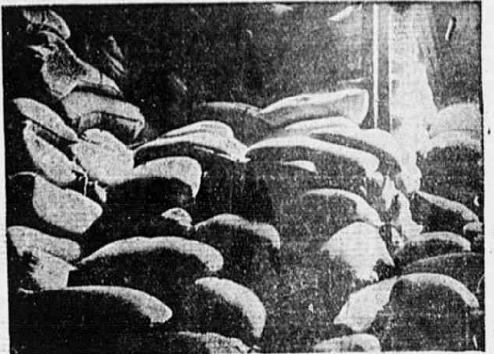
Enquanto falta o feijão na marmita do trabalhador, aqui, na Estação de Expurgo estão depositadas há mais de dois meses cerca de vinte mil sacas, de propriedade do governo

Depois de outras considerações, disseram ainda que uma vez financiada a aquisição pelo Banco do Brasil, está transferida o estoque à Comissão de Financiamento da Produção, ficando esta encarregada de utilizar o negocio. Outras vezes, também, compete ao Banco colocar a pedido do Governo o produto em determinadas praças. De qualquer forma, porém, o fato é que o Governo é possuidor de grande numero de sacas de feijão. Acontecendo estar o mercado do Rio em falta, cabe às autoridades providenciar a sua remoção para esta capital, contribuindo para a solução da situação. (CONCLUSÃO NA 2.ª PAG.)