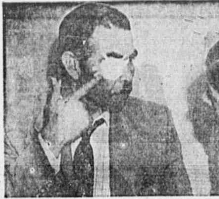
Um dos operários da Light, vítima da sanha criminosa dos policiais, quando entrevistado, na época, por uma redatora da TRIBUNA POPULAR