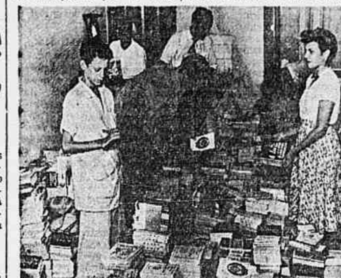
Na Distribuidora Anteu, funcionários trabalham na classificação dos livros