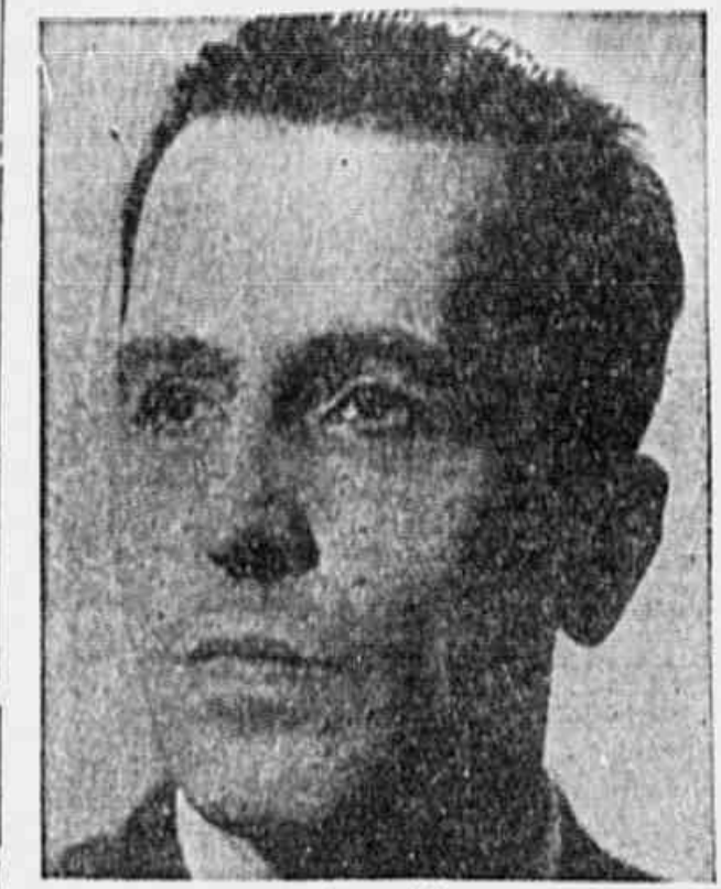
Transcrevemos abaixo, "data entrevista concedida pelo senador Luis Carlos Prestes ao "Jornal de Debates", na qual o Secretário Geral do PCB, respondendo as perguntas formuladas, mostra, mais uma vez, a posição dos comunistas em sua luta pelo progresso e bem-estar do povo:

Através dos recursos parlamentares os comunistas estão certos de que poderão começar a resolver os problemas nacionais — Respeito a todas as crenças e apoio do Estado às artes e às ciencias — Declarações de Prestes ao "Jornal de Debates"