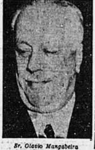
Sr. Otavio Mangabeira

Empenhado todo o PCB nos preparativos. Todo o Partido Comunista no Distrito Federal está trabalhando ativamente para o gigantesco comício de encerramento da sua campanha eleitoral — comício "O Primeiro Lugar Para o Partido de Prestes" — que deve ultrapassar a todos os outros já realizados e ser a maior demonstração de massas de todos os tempos realizada em nossa terra.