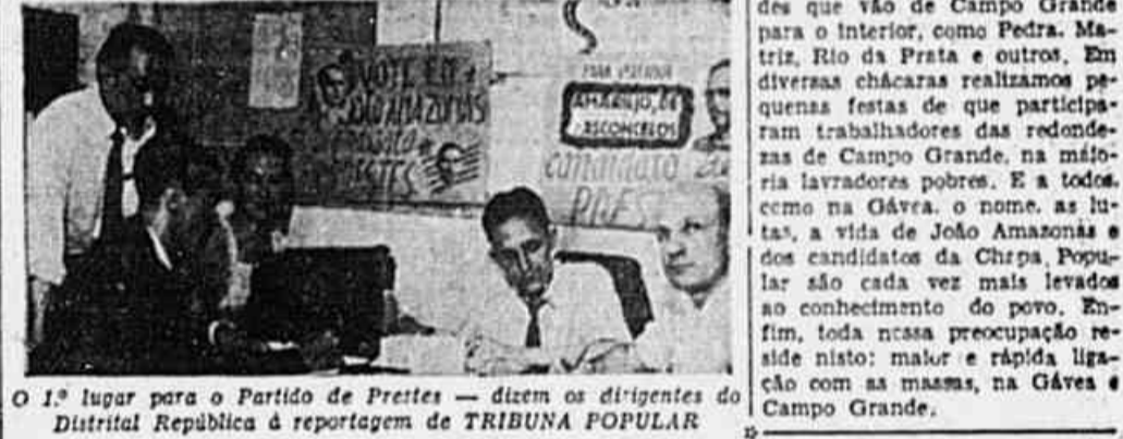
O 1.º lugar para o Partido de Prestes — dizem os dirigentes do Distrital Republica à reportagem de TRIBUNA POPULAR

Estamos a poucos dias das eleições de 19 de janeiro. que consolidará a democracia em nossa Pátria, quando o povo terá oportunidade de dar o seu apoio ao verdadeiro Partido Nacional que defende os seus interesses. O P. C. B. Nesta última Semana do Sacrifício da Campanha Eleitoral, está empenhado o glorioso Partido de Prestes, através de todas as suas Células e seus militantes, cada vez mais ligados às massas, levando a todos os partidos nos mais longínquos bairros a palavra de ordem decisiva e sentida por todo o povo carioca, que é dar o 1.º lugar para o Partido de Prestes.