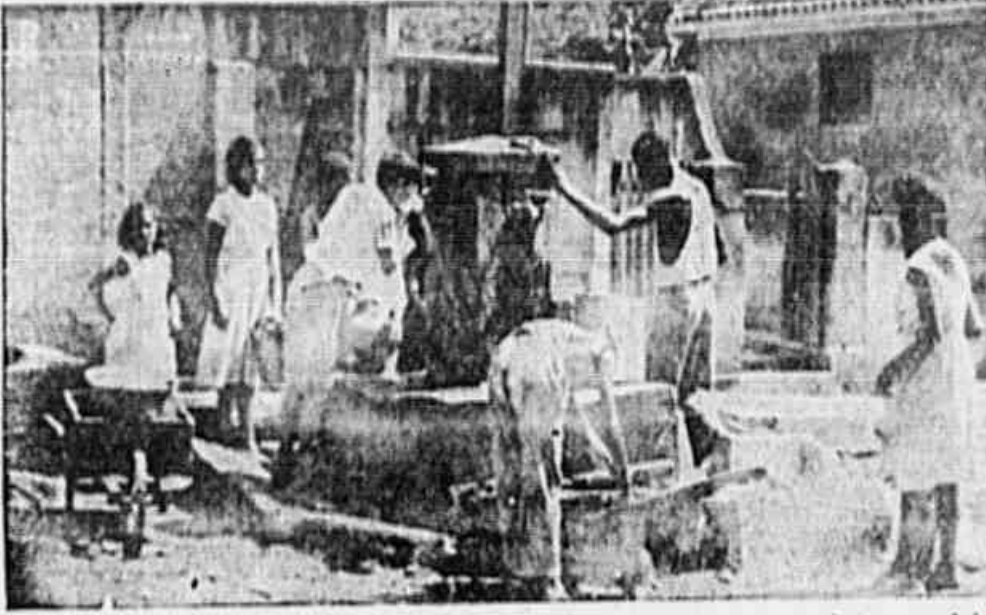
Esta é a única bica existente na Engenho de Dentro, cuja água é utilizada para tudo inclusive para beber e no próprio local, como se pode ver na gravura acima