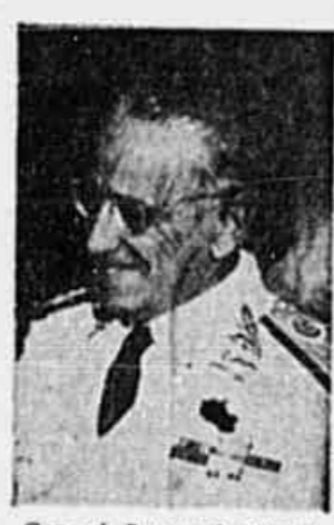
General Demerval Peixoto

Declarações do General Demerval Peixoto, interventor em Pernambuco — Considerada como certa a vitória do candidato do P.C.B. ao governo pernambucano — Sucesso sem precedentes a excursão de Prestes naquele Estado — Importantes problemas políticos abordados numa entrevista coletiva