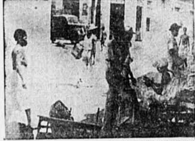
Estes balaios de peixe, espertos à beira da rua e rodeados de moscas, atestam a miséria dos que habitam os bairros pobres da Capital fluminense

Nem mesmo bondes há na Engenho — O que são os contratos lesivos aos interesses nacionais — As moscas voam em torno dos balaios de peixe, dispostos na calçada suja — "Deus ajude que venha a vitória dos comunistas nas eleições" — afirma-nos uma mulher do povo