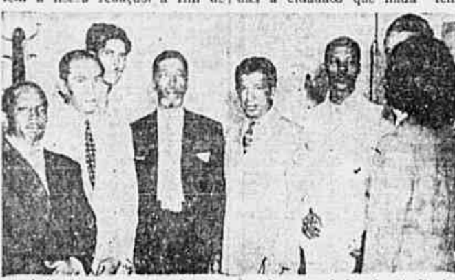
Trabalhadores no Comercio Armazenador, associados do Sindicato, quando falavam à redação