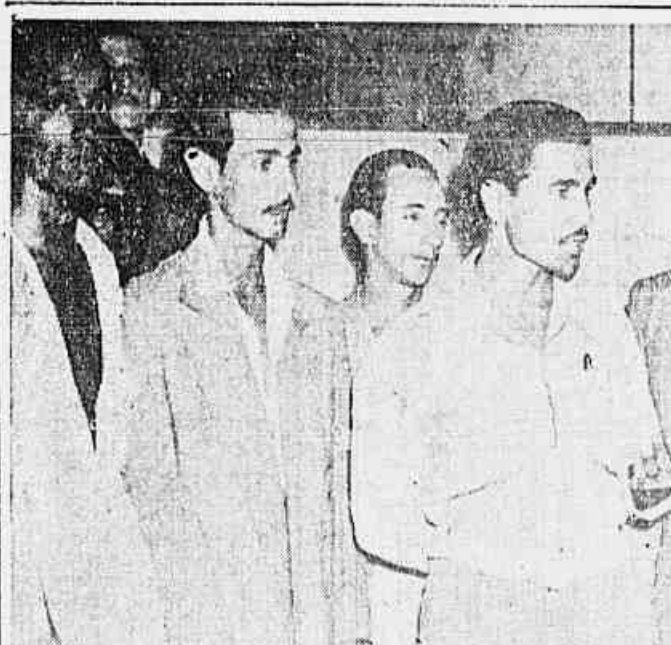
A COMISSÃO DE SALÁRIOS DO SINDICATO DOS MARCENEIROS CONTA COM O APOIO IRRESTRITO DOS OPERÁRIOS DA "INDÚSTRIA DE MOVEIS DE PARA"...