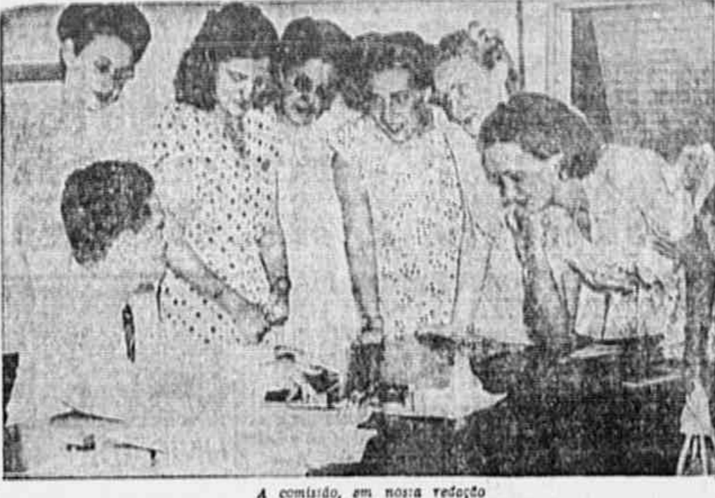
A comissão, em nossa redação

Tribuna POPULAR Diretor - PEDRO POMAR Redator-Chefe - AYDARO DO COITO FERREZ Gerente - WALTER WEISSBERG AVENIDA APABICIO BORGES 207, 1º ANDAR - TEL. 22-3078 ASSINATURAS - Para o Brasil e America... ANOS DO ANUAL CAPITAL C$ 0,50 INTERIOR C$ 0,60.