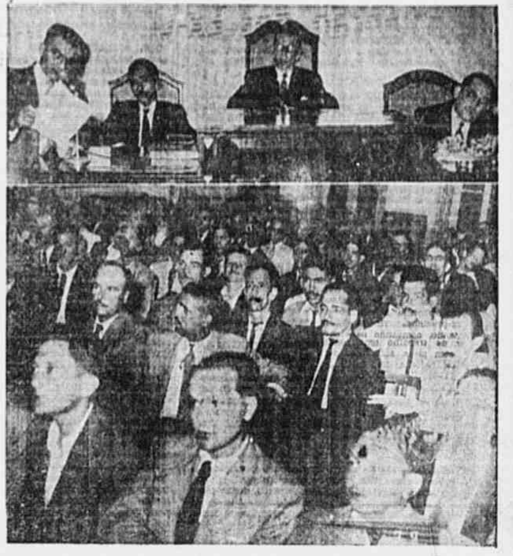
Aspecto da mesa e parte da grande massa presente à reunião do Sindicato da Carris