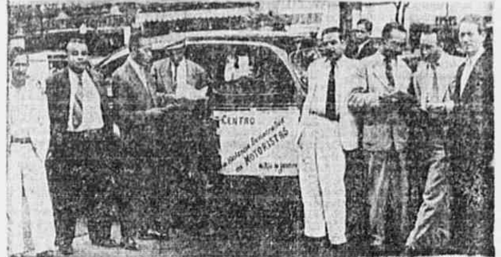
Os motoristas quando, no Largo da Carioca, fala ram ao repórter da TRIBUNA POPULAR, sobre o automóvel com cartazes a respeito da campanha.

Mas não são os motoristas os causadores desse desequilíbrio e não está ao nosso alcance solucionar tão complicada problema; e não será privando os motoristas e suas famílias do sagrado direito de viver com dignidade, diminuindo-lhes o salario já tão escasso para enfrentar a carestia atual, que esse problema será solucionado. Que venham as medidas capazes de fazer voltar ao normal os preços de custo das utilidades, dos gêneros, dos alimentos e de tudo em que se relaciona com a economia da cidade de toda a população e os motoristas não serão os ultimos a abrir mão do seu aumento de salario, ou seja o rebovamento do custo de seu trabalho.