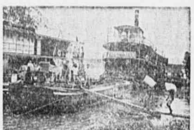
Os marinheiros são obrigados a trabalhar na estiva, além das horas de fama e bordo

Reportagem de Heliodoro de Carvalho (Copyright da NTER PRESS)