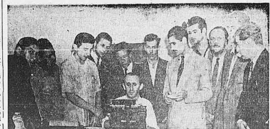
AMANHÃ, AS 18 HORAS, NA SEDE DO SINDICATO DOS AEROVIÁRIOS, OS TRABALHADORES DA EMPRESA DE NAVEGAÇÃO AEREA CRUZEIRO DO SUL realizarão uma importante assembleia para discutir o memorial que acaba de ser entregue à empresa, e no qual está contido o seu programa de reivindicações de aumento de salários e condições mais humanas para os operários que ali trabalham.

PANAMÁ, 19 (U. P.) — O Governo do Panamá comunicou aos Estados Unidos que insiste em seu critério de que o ano de prazo — transcorrido o qual deveriam ser entregues ao Panamá todas as bases militares construídas pelos Estados Unidos no referido país — venceu-se em 1.º de setembro e que os Estados Unidos deviam devolver ao Panamá todas as bases na cidade data.