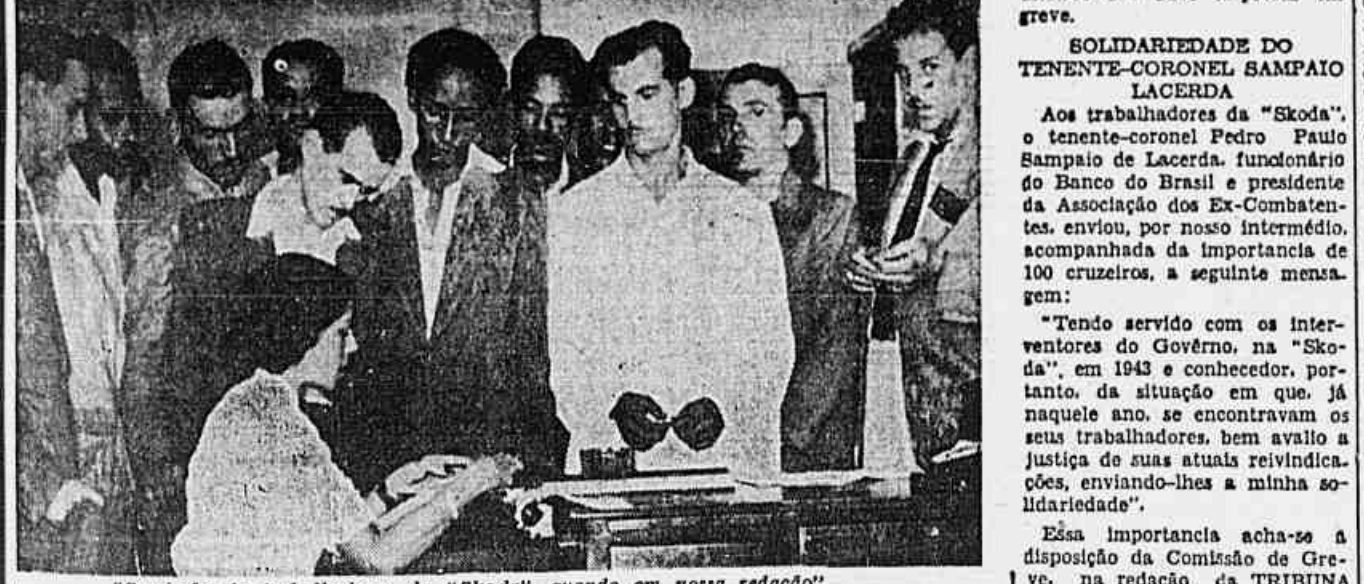
"Comissão de trabalhadores da "Skoda", quando em nossa redação"

Esteve presente à reunião dos operários o presidente da "Skoda" — Criadas a Comissão de Greve e duas sub-comissões — Unidos os grevistas das duas empresas — Cresce o movimento de solidariedade e apoio financeiro aos grevistas