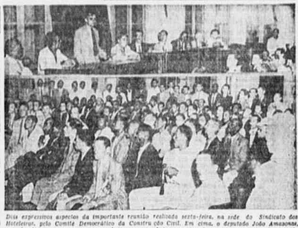
Dois expressivos aspectos da importante reunião realizada sexta-feira, na sede do Sindicato dos Hoteleros, pelo Comitê Democrático da Construção Civil. Em cima, o deputado João Amazonas, quando dirigiu-se aos seus companheiros, e em baixo aspecto da massa presente à reunião