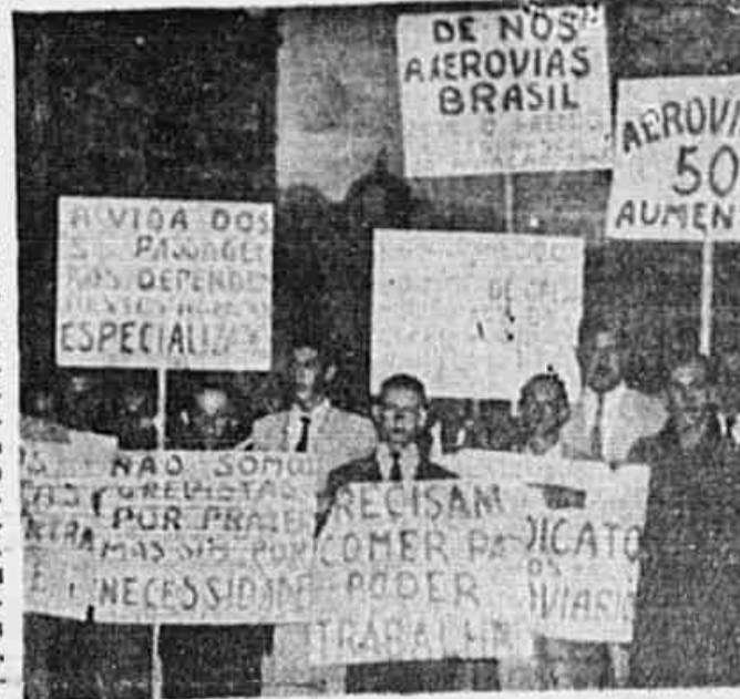
A diretoria da TRIBUNA POPULAR firmou este entusiástico grupo de grevistas, no momento em que se preparavam para desfilarem pela cidade, carregando cartazes alusivos às suas reivindicações