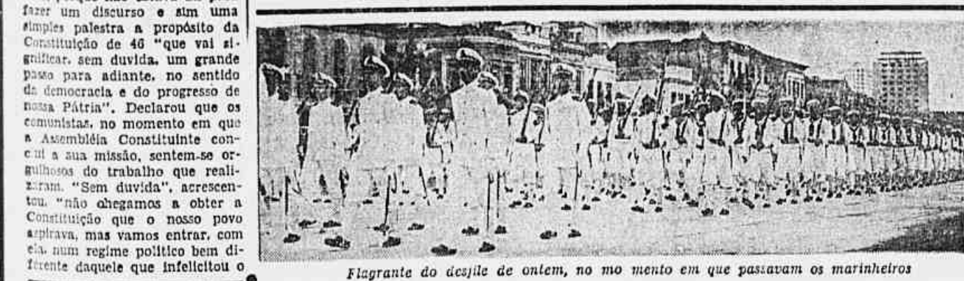
Flagrante do desfile de ontem, no momento em que passavam os marinheiros

Recordou que, no fim da semana passada, a Assembleia Constituinte, tomou em suas mãos os destinos da democracia, sabendo defendê-la com vigor. Referiu-se à demora nos trabalhos da Grande Comissão, que não foi a Comissão de Juristas proposta pela bancada comunista, observando que no plenário foi dispendido menos tempo na discussão e votação da Constituição. Informou que as emendas apresentadas à Comissão Constitucional pelo representante do PCB, foram todas rejeitadas, mas que o Partido continuou a lutar, no