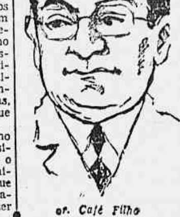
or. Café Filho

Reafirmando nossos propósitos de apoiar o governo nas medidas que vier a tomar pela rápida solução da miséria, da inflação e da carestia e contra os fascistas ainda nos postos de governo, manifestamos também a nossa determinação de colaborar com a formação de um governo de confiança nacional, indispensável para assegurar a ordem democrática e republicana e tornar impossível qualquer nova (CONCLUÍ NA 2ª PAG.)