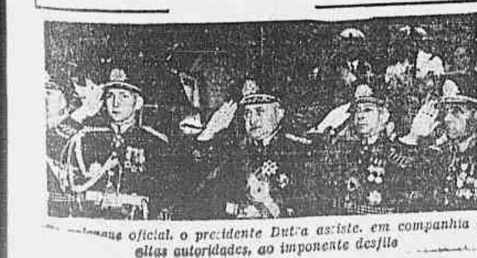
Oficial, o presidente Dutra assiste, em companhia de altas autoridades, ao imponente desfile

O povo aplaudiu ontem os soldados do Brasil — A presença da FEB e dos marinheiros que combateram corsários do Eixo — Homenagem dos adidos militares ao General Canrobert