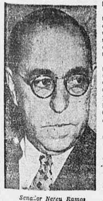
Senador Nereu Ramos