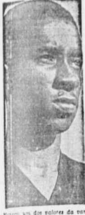
Um dos jogadores da equipe rubra que está a ser levado ao campo em São Januário.

Dispostos os rubros a uma revanche dos 3 x 2 - Os niteroienses pretendem repetir a façanha - Favorito porem o gremio de Campos Sales - Os quadros