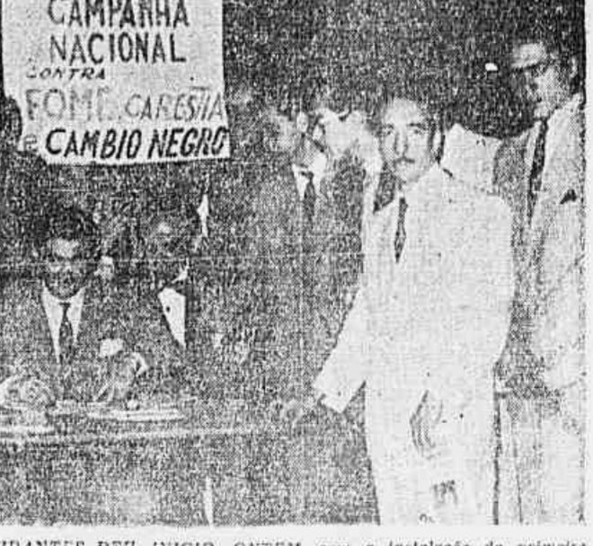
A UNIAO NACIONAL DOS ESTUDANTES DEU INICIO, ONTEM, com a instalação da primeira mesa de reclamação, no largo da Carioca, à campanha contra a fome, a carestia e o cambio negro. Ao lado de instalação ocorreu grande massa popular, sendo que varias reclamações foram apresentadas e encaminhadas à Comissão de Informação, para apurar a veracidade das mesmas. Outras mesas serão criadas em varias escolas e bairros da Capital. Hoje será instalado a mesa da Faculdade de Direito do Rio de Janeiro, à rua do Catete. Na foto populares quando apresentaram suas reclamações.