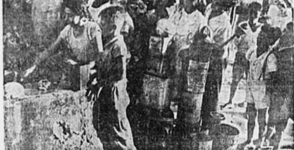
FALTA ÁGUA EM TODA A CIDADE DO RIO DE JANEIRO. No centro, nos bairros, nos subúrbios, as ruas estão cheias de apartamentos desocupados, à espera de luzes e preços altos, também não pingam água. Na maioria das penides já separam os pratos fritos, os talheres vêm sujos e não existe água nos quartos. Mas a situação ainda é mais grave para a população dos morros e dos lugares onde não há sequer, uma bica. Na gravura, vemos um grupo de moradores do morro do Quatzen e do Rio Comprido, junto ao tanque de uma casa particular, na rua Almirante Cavalcanti, a ver se conseguem uma gota do precioso líquido. Depois de andarem quilômetros subindo e descendo ladeiras.

O local da reunião, será a RUA DAS ACÁCIAS, 99. Dona de casa! Mãe de Família! Não falte a essa reunião, pois somente em companhia de outras donas de casa e mães de família poderemos combater o comércio negro e os especuladores.