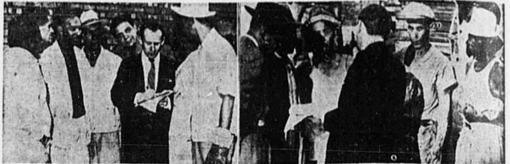
Os portuarios do Rio quando, ontem, falavam á reportagem da TRIBUNA POPULAR, no Cais do Porto

Aproxima-se o fim do assaio Franco. Os trabalhadores de todo o mundo receberam o apelo da Federação Mundial dos Sindicatos e da Confederação Geral dos Trabalhadores da America Latina como uma civildade honra. Estão decididos, á custa de todos os sacrificios, a boicotar os navios da Falange que conduzem generos alimenticios, não para o heroico povo espanhol, que na Península Iberica morre de fome, mas para alimentar toda a matilha nazi-falangista que continua jogando nos carceres e nos muros dos pelotões de fuzilamento, os melhores filhos da patria de La Prisionaria e José Diaz. Como os heróicos estivadores e doqueiros de Santos, que não mais estão carregando e descarregando os navios espanhóis do caudillo, os portuarios do Rio e de todos os portos democraticos do país, da America e de outros continentes, apressaram o fim do tiranico franquismo.