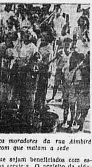
A uma distancia consideravel são os moradores da rua Aimbiré Cavalcanti buscar a agua com que matam a sede

que sejam beneficiados com esses serviços. O prefeito da cidade deve exigir dos funcionários responsáveis por tais delinções o fiel cumprimento das suas atribuições.