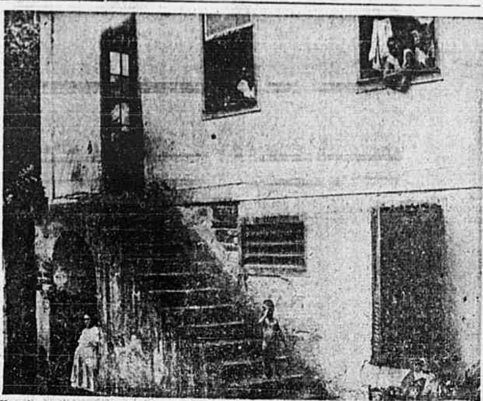
Uma das muitas casas de cômodos em que os inquilinos já são explorados, mesmo sem o aumento

Hoje, ás 18 horas, á rua Leopoldo 280, no Andaraí, terá lugar a festa de aniversario da Celula Noel Rosa, do Partido Comunista do Brasil, com uma parte artistica e outra dançante.