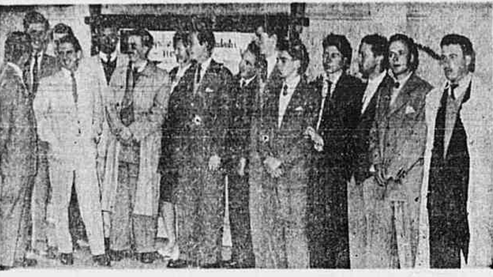
Delegados ao Congresso Nacional da União Nacional dos Estudantes, quando ontem falaram à nossa reportagem, na sede daquela entidade

Pela união crescente de toda a classe e defesa dos princípios democraticos — Delegações de todos os Estados — Vários delegados falam à TRIBUNA POPULAR