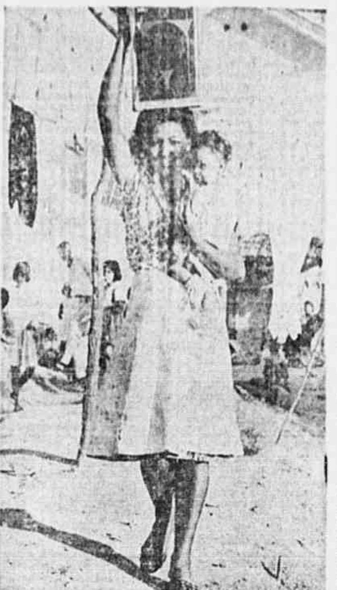
Com a lata na cabeça e o filho nos braços, dirige-se para o tanque

"Habitat" de larvas dos mais variados agentes de doenças infecciosas — Pagam impostos e taxas mas não são beneficiados