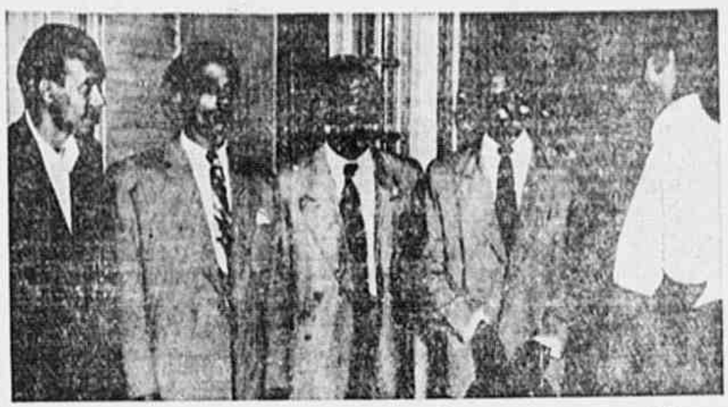
Trabalhadores da secção de carros de Jardim Botânico falando ao nosso redator

de Light que de fato desajustam ver reintegrados nos cargos que ocupavam, os companheiros que sofreram em sua própria carne o terror policial da Light, a votarem "Não". Votando sim os empregados da Light estarão, na prática, declarando a empresa que a eles não interessa a reintegração daqueles desmoralizados companheiros. Votando "Não" estarão, pelo contrário, exigindo da empresa a reintegração, contados os dias e vanta em sua própria carne, os danos físicos e morais que os fatos de lutar por condições de vida mais decente para todos nós.