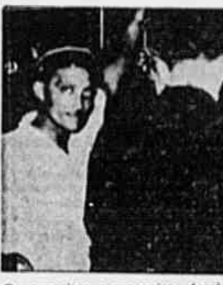
Os grazeiros e mecânicos também exigem a readmissão dos seus companheiros despedidos

Uma vez "Nao!", e quantos plebiscitos a Light fizer, o meu voto será sempre "Nao!"