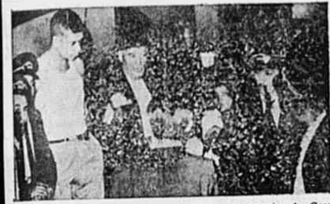
"Não", será o nosso voto — dizem os operários da Casa de Carros da rua Humaitá

Desmascarada a manobra audaciosa da imperialista companhia canadense — "Não somos os traidores; fazemos questão absoluta da readmissão dos onze membros das Comissões de Salários despedidos" — Falam à TRIBUNA graxeiros, mecânicos, eletricitas, condutores, torneiros e fiscais