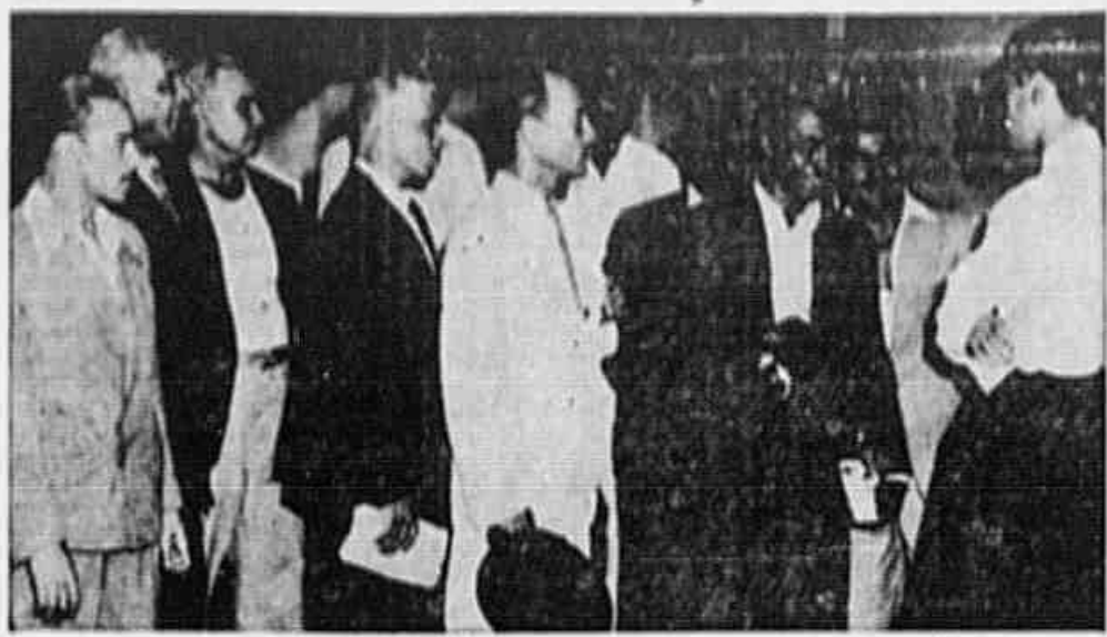
Elementos da comissão de marítimos, quando passaram ao nosso redator