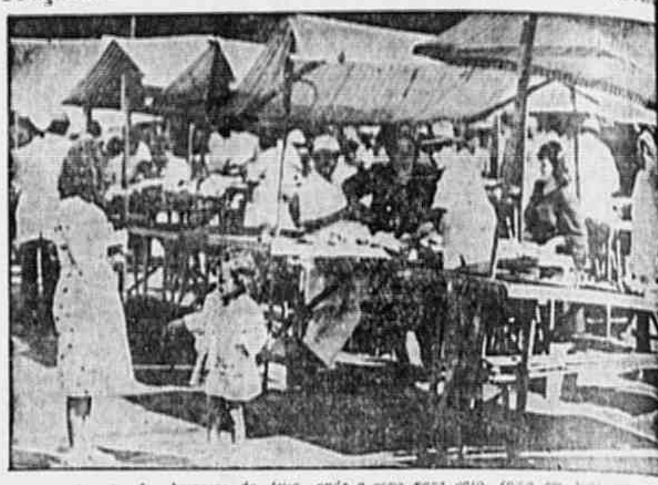
Um quilo de tomates custa 3 cruzeiros, o de qualidade inferior, e 5 o melhor. Queremos lembrar que esteve há poucos dias em nossa redação um camponês gaúcho, hoje colono em Santa Cruz, que foi impedido de vender os seus produtos na feira da Tijuca, tendo nos declarado que vendia a 30 centavos o quilo de tomate. O preço cobrado na feira é portanto um absurdo, constituindo um verdadeiro assalto à bolsa do povo.

VERDADEIRA EXPLORAÇÃO Anotamos alguns preços. Queremos ressaltar, entretanto, que, a feira da Praça da Bandeira é, senão uma das mais populares, o termo médio, pelo menos, entre as granfinas dos bairros chiques e as mais pobres existentes. Isto quer dizer que há preços mais caros, só sendo de todo improvável que existam mais baratos.