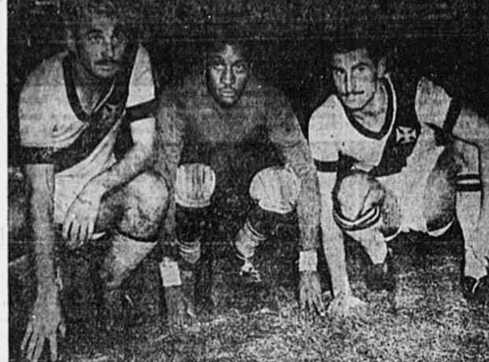
Os jogadores do Vasco da Gama e Fluminense, três meses antes de se enfrentar no campo de São Januário.

A CONQUISTA DEFINITIVA Enquanto isso, os cruzmaltinos procuram obter um vitória ou um empate para se estabelecerem para o terceiro jogo e assim iniciarem a escalada para a posse definitiva do troféu. Este, de acordo com as normas que o instituíram, será entregue de definitivo ao clube que conquistar por três vezes consecutivas o título supremo no Torneo.