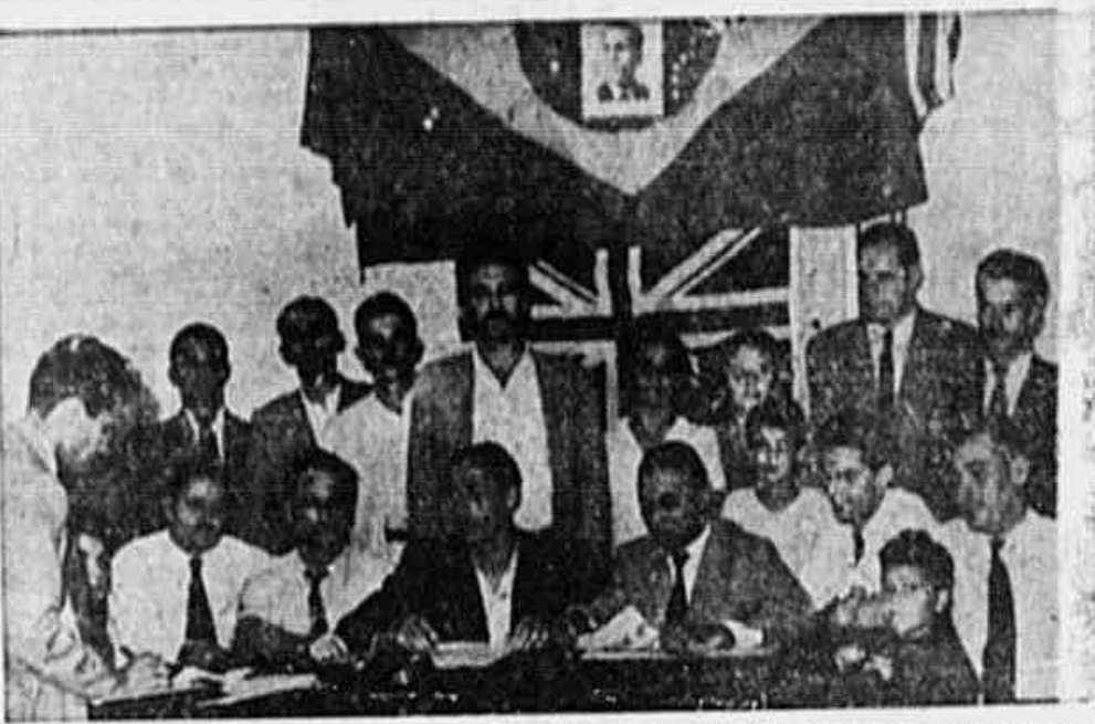
Na sede do Comitê Distrital Sul, militantes comunistas falam à TRIBUNA sobre o Pleno Ampliado