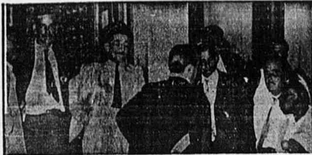
Os trabalhadores da Light dizem ao nosso jornal que não trairão os seus companheiros das Comissões de Salários

PREFIRAM VIDROS MAIORES — GRANDE ECONOMIA