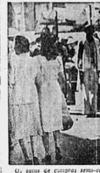
Os sacos de compras semi-vazios denunciaram o baixo poder aquisitivo da nossa população.

Os feirantes também reclamam contra as impostos e os preços e todos que dizem pagar pelos seus gêneros, pretendendo assim utilizar a importância por eles cobrada.