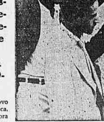
Um grupo de operarios, quando falava à nossa reportagem sobre a chacina do Largo da Carioca

Um mês após o massacre, Imbassai, Pereira Lira e sequazes continuam conspirando contra a democracia — O revoltante massacre do dia 23 e uma "enquête" rápida da TRIBUNA POPULAR