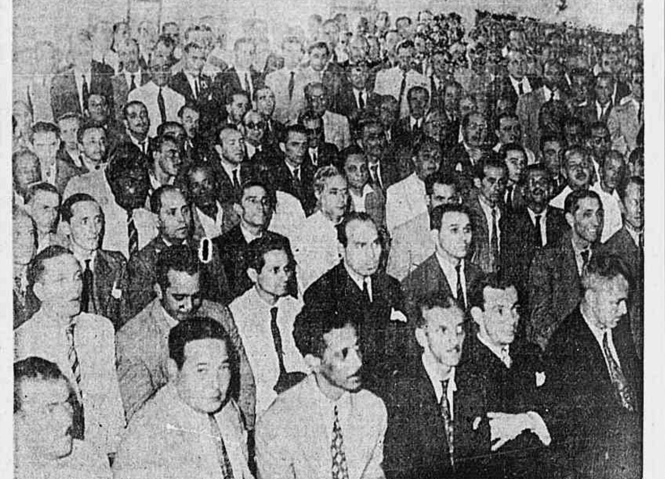
Aspecto parcial da grande assembléia de ontem dos empregados em Cassinos