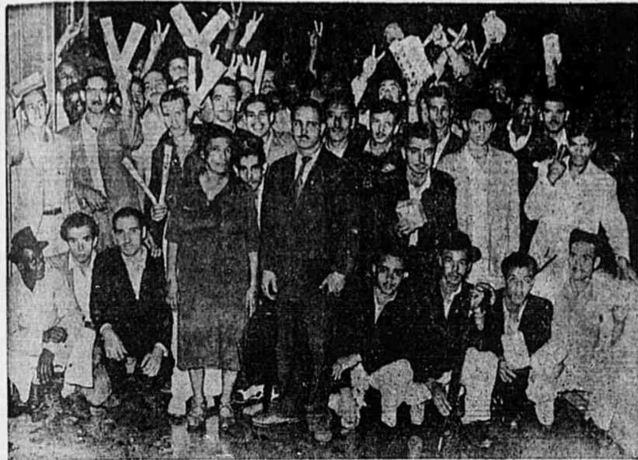
A numerosa comissão que aparece na gravura acima, representa milhares de trabalhadores que conseguiram, em dissídio coletivo, a melhoria dos seus miseráveis salários. O pagamento devia ser efetuado 48 horas depois da decisão da Justiça do Trabalho, a 25 de abril. E até hoje nenhum patrão quis pagar.