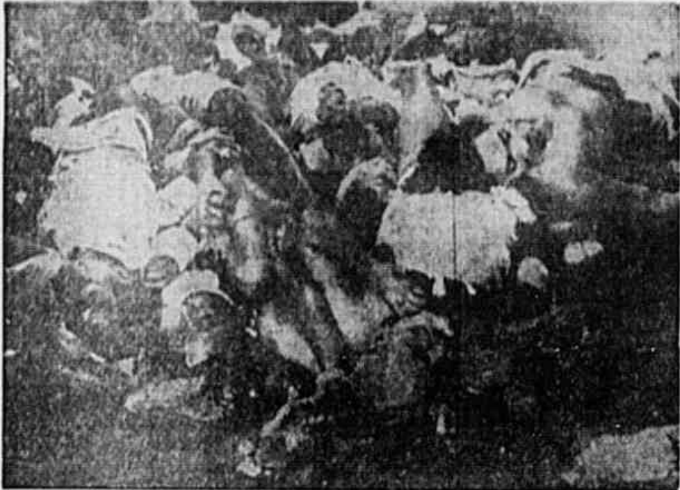
ESTES CADAVERES DE HABIHANTES DE LONDAIM jazem na "morgue" do Hospital tel Eduardo, naquela cidade. São os corpos dos indios massacrados pelas tropas britânicas nos dias 22 e 23 de fevereiro. O "crime" pelo qual os imperialistas ingleses os fuzilaram foi terem sido uma demonstração pacífica, conduzida por eles — suas únicas armas. Estavam manifestando sua solidariedade aos marinheiros da Armada Indiana que se haviam revoltado contra as duras intoleráveis condições de vida. Nesse mesmo dia, 23, o governo "trabalhista" de Sua Majestade enviou congratulações aos Estados Unidos pela passagem do aniversário do nascimento de George Washington, que chefou a guerra pela Independência da América.

ANO II * N.º 293 * TERÇA-FEIRA, 7 DE MAIO DE 1946