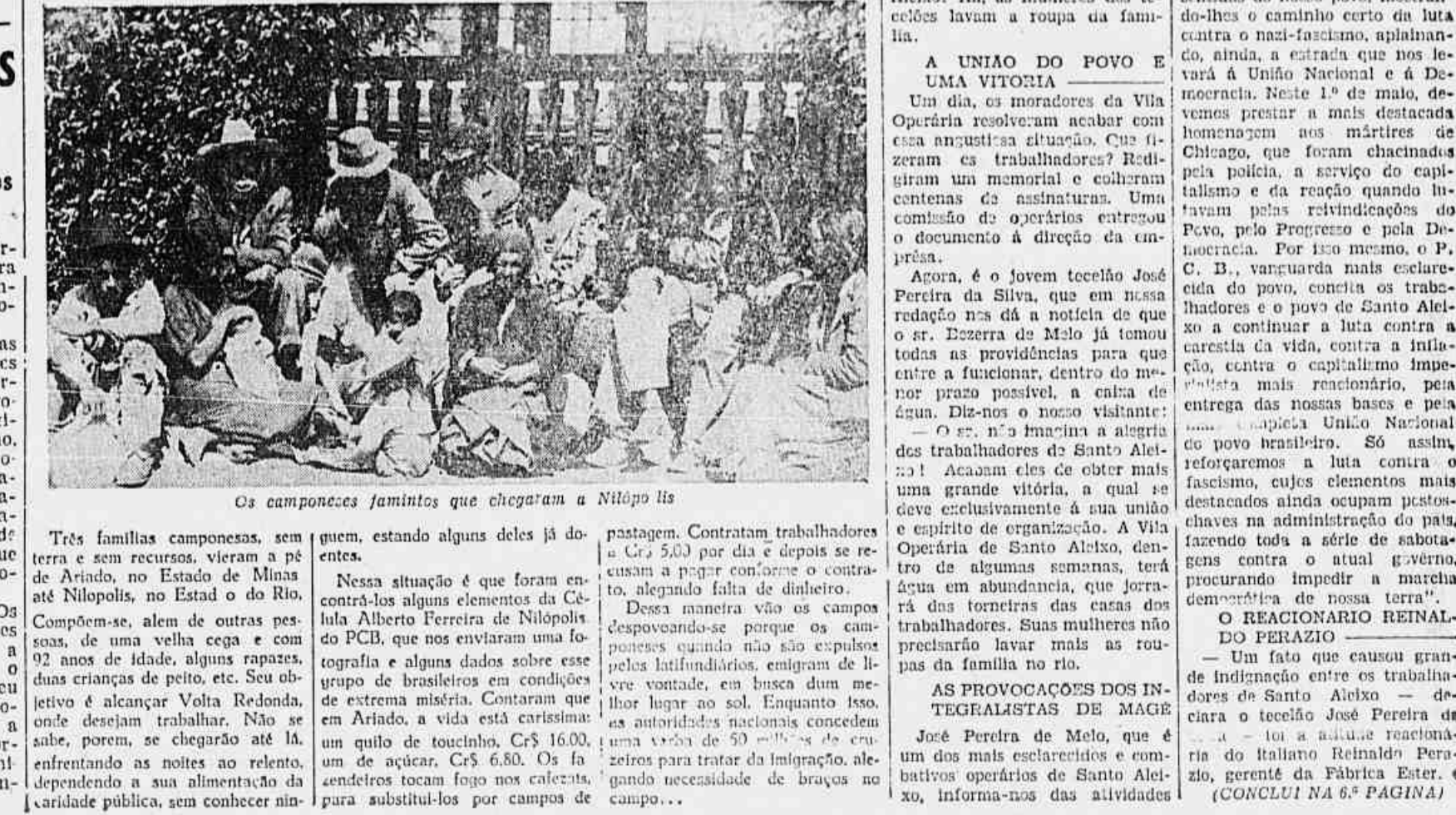
Os camponeses famintos que chegaram a Nilópolis