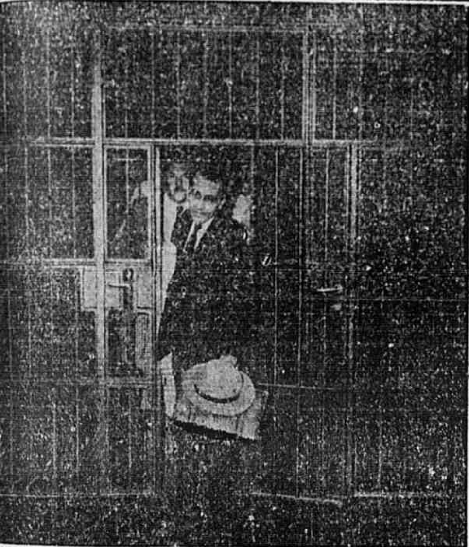
Foto de uma fotografia que corre mundo. Foto com uma justaposição pelo fotógrafo brasileiro Leite, e a foto do momento em que Luis Carlos Prestes, o líder querido do povo brasileiro, transpunha a porta da Penitenciária Central do Distrito Federal, onde esteve segregado do mundo durante mais de nove anos, desde a época em que extimou a atenção do fascismo no Brasil até aos dias em que o governo se viu forçado a ceder à pressão popular, decretando a libertação dos presos políticos. Prestes, Secretário Geral do Partido Comunista do Brasil e senador eleito pelo voto popular, aparece ao lado do capitão Trifunjo Corrêa, seu antigo comandante da Coluna Invicta e hoje deputado comunista pelo Rio Grande do Sul, e o ministro Orlando Leite Ribeiro, também seu amigo de longa data, atualmente um dos representantes do Brasil junto à Organização das Nações Unidas.