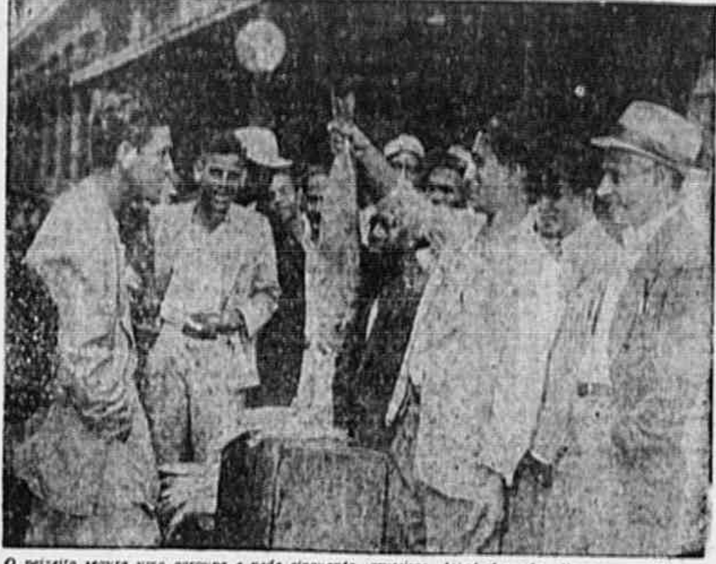
O peixe segura uma garupa e pesa cinquenta cruzeiros. As ofertas não atingem o pedido e os populares ficam de boca aberta

Em tempos idos o carioca conhecia a fartura do peixe. Os comitês para as peixarias familiares há muito que escassearam. Já passou a época em que se comia peixe por economia. Hoje, o peixe custa duas vezes mais que a carne; não porque haja escassez, mas devido à existência de uma organização que, há mais de um ano explora a sua venda. Trata-se da Cooperativa dos Armadores e Pescadores, que, desde a sua criação, tem se ocupado unicamente em explorar o comércio do peixe, e particularmente o pescador. Já nos habituamos a passar pela Praça 15 de Novembro e sentir a fedentina do peixe podre armazenado no Entrepósito da Pesca, que deixa de ser vendido para que não baixem os preços, defendidos com unhas e dentes pelos interessados no negócio. Aliás, pode-se influenciar, por certo, ainda protegendo a entidade, verdadeiro remento do estacionarismo, que consome toneladas de peixe ao consumo da população.