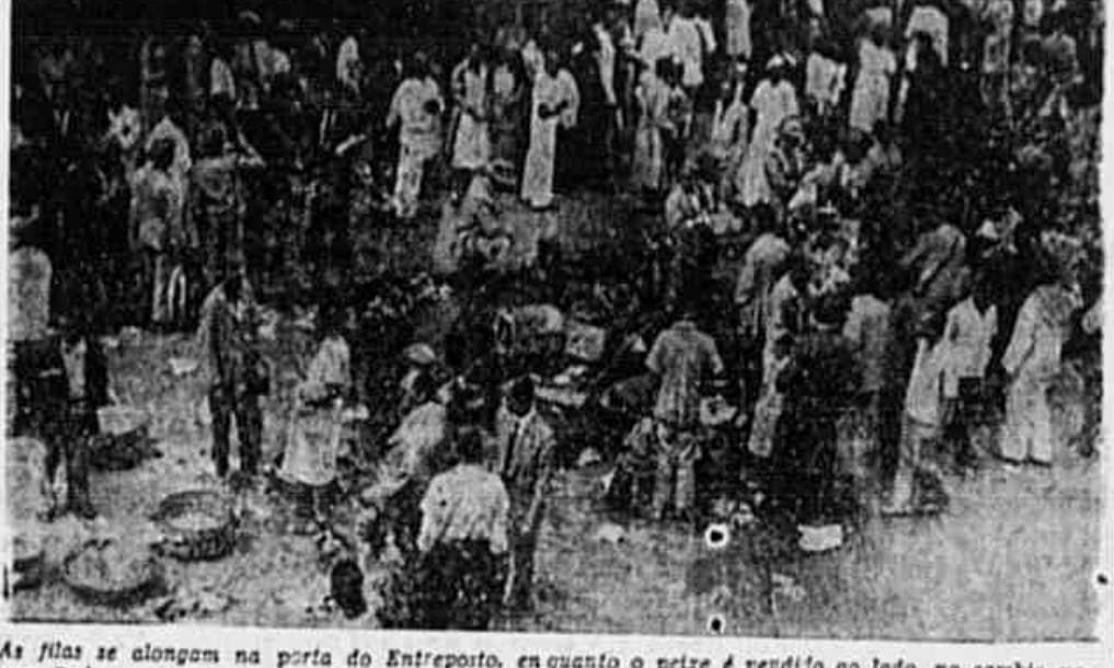
As filas se alongam na porta do Entrepósito, enquanto o peixe é vendido ao lado, no cambio negro. Pode-se ver na gravura até soldados da Polícia Militar no primeiro plano

CAMBIO NEGRO NA PONTA DO CAJU A Divisão da Caça e Pesca tabelou ante-ontem a venda do peixe no Distrito Federal. Como seria de se esperar, os preços estipulados nesse tabelamento são excessivamente altos, especialmente o dos peixes mais procurados, que variam entre oito e doze cruzeiros o quilo. No entanto, a Cooperativa dos Armadores e Pescadores, que compra todo o peixe aos pescadores para revendê-lo, estabeleceu bases relativamente baixas para essa aquisição. O resultado não se fez esperar. Ante-ontem três embarcações de pesca, com grandes carregamentos, não sportaram ao ter conhecimento de seus padrões do quanto iriam receber pelo pescado, indo vendê-lo no