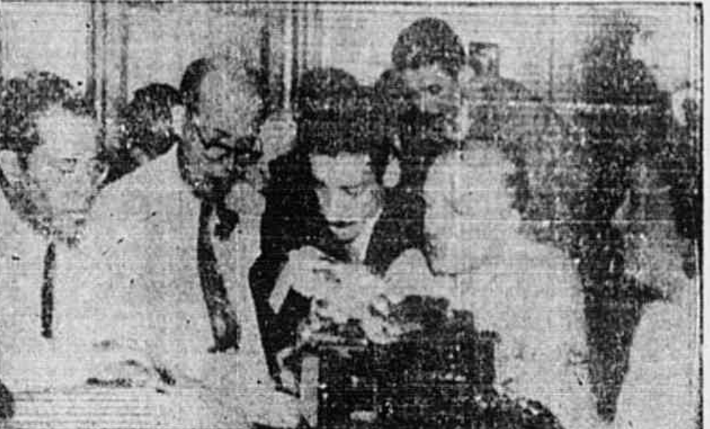
Fragante a Comissão Organizadora do grande comício do dia 22, reunida, ontem, à noite

Podem-nos a publicação do seguinte: "Não espere que lhe preparem: tome a iniciativa de contribuir para o grande comício do dia 22, segunda-feira, na Esplanada do Castelo, às 16.30 horas, organizando uma comissão pró-comício no seu bairro ou no seu local de trabalho. Esta é orientação fundamental no sentido organizativo que devem ter todas as organizações ou pessoas para os trabalhos do grande comício. As presentes instruções devem ser levadas à prática com urgência, se possível logo após a terminação da sua leitura. 1) Distribuir ao máximo o manifesto da Comissão Central do Comício, de porta em porta, nas ruas, nas oficinas, nas construções, nas fábricas, fazendo o "camelot" nessas reuniões. 2) Fazer a campanha do "camelot" intensamente nas ruas, nas saídas dos grandes edifícios, fábricas, repartições, escolas, pontos de concentração de massa, filas de ônibus, etc. 3) Realizar palestras rápidas nos locais de trabalho. Falar nas ruas, nos cafés, nas filas, nas casas dos conhecidos, sempre em função do comício e em voz alta. (CONCLUÍ NA 2.ª PAG.)