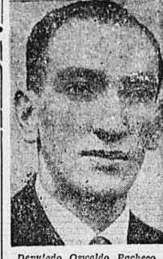
Deputado Oswaldo Pacheco

Devido à sua atitude em defesa da democracia os trabalhadores das Docas de Santos estão sendo hostilizados - Mas a fome não pode esperar - Revelações do deputado Oswaldo Pacheco à TRIBUNA POPULAR