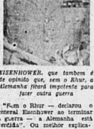
EISENHOWER, que também é de opinião que, sem o Ruhr, a Alemanha ficaria impotente para fazer outra guerra

O papel que a Rhenania vem representando na história da Alemanha imperialista — Em 1811, Essen era uma aldeia — Em 1846 já fabricava canhões de aço — Uma velha tática que sempre se repete