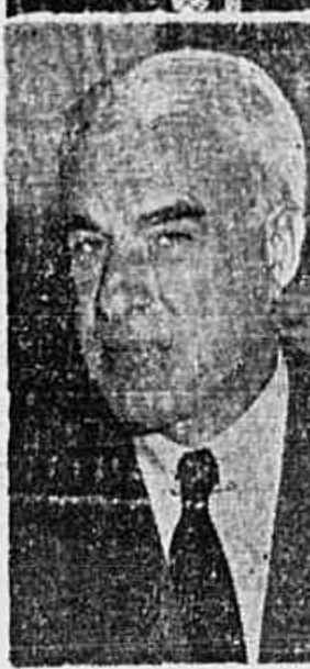
Byrnes e Stettinius