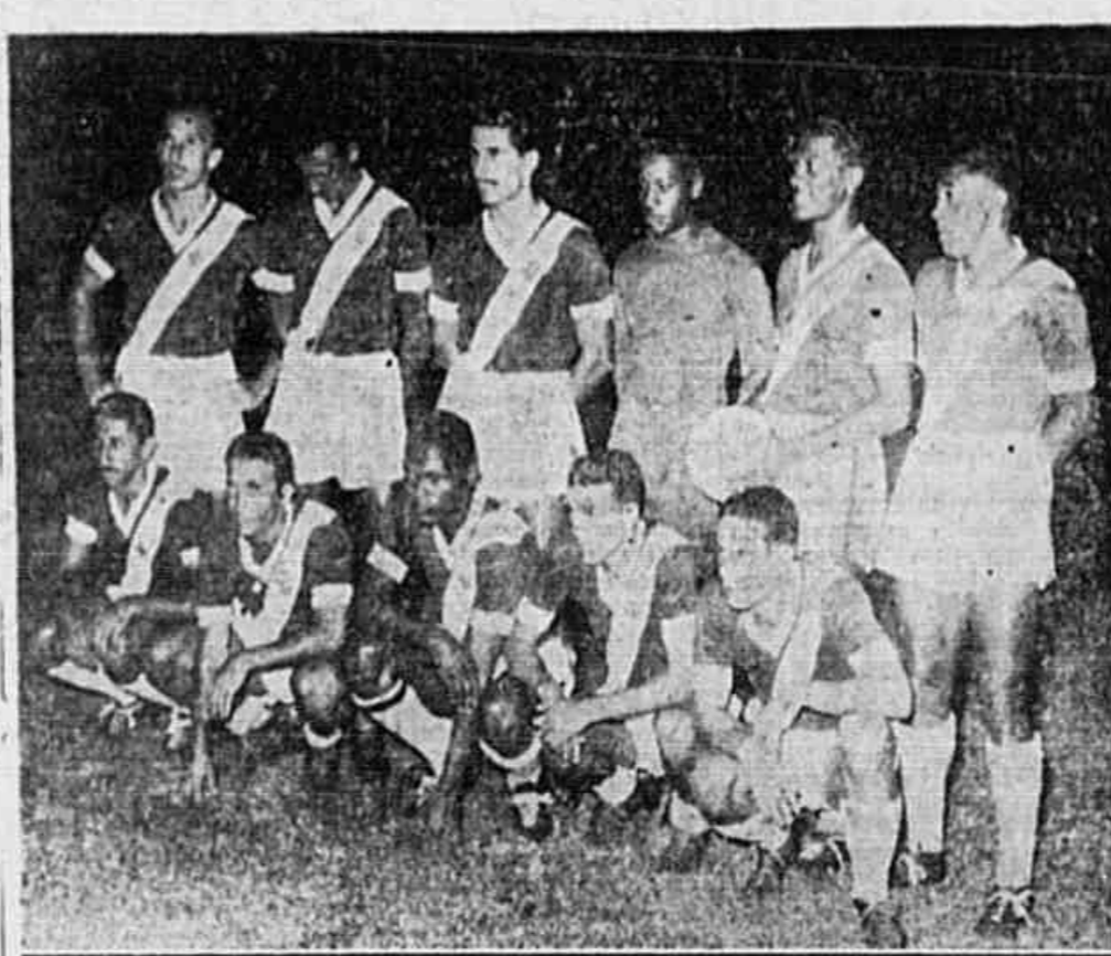
O quadro do Vasco que atuou ante-ontem

A atuação do Vasco da Gama no encontro com o São Paulo, se não decepcionou totalmente, pelo menos não satisfaz a torcida cruzmaltina. O fato o quadro vasco, encarado pelos seus melhores jogadores, não conseguiu superar o seu adversário, como desfalco no segundo tempo. Ao quadro do Vasco falta não só preparo em conjunto como também individual. Vários jogadores estão pecando, e não conseguem entender entre si.