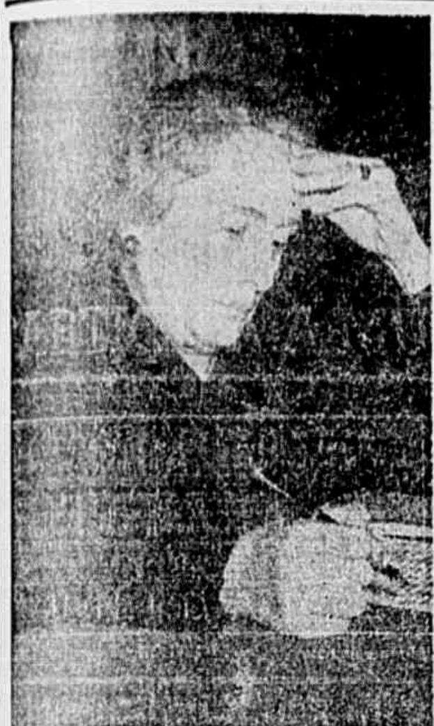
Dolores IBARRURI em pleno trabalho, durante uma das sessões do 1.º Congresso Internacional de Mulheres em Paris...