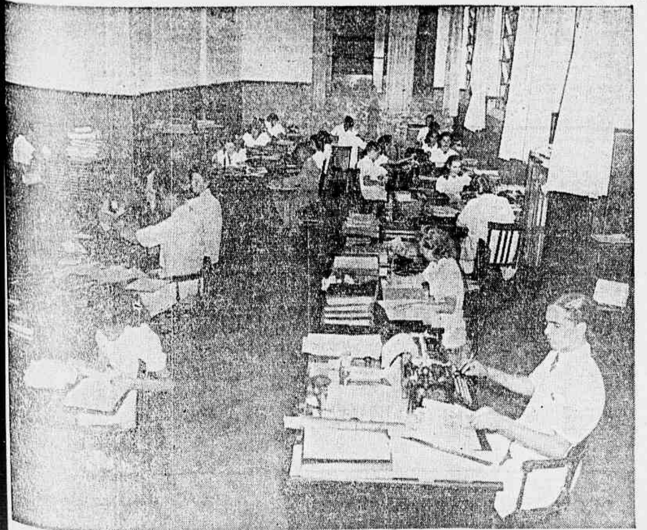
Funcionários da firma em plena atividade em seus escritórios

E saímos trazendo na lembrança o "slogan" do Colírio Moura Brasil — "Olhe a vida com bons olhos..."