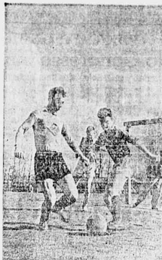
FOOT-BALL NA URSS — Com o empate obtido no seu match de estreia, o Dinamo marcou o estado de progresso do futebol na U.R.S.S. O tri-campeão soviético marcou três goals no Chelsea, em dois minutos quatuorze minutos. Depois de tantos anos, o sport da U.R.S.S. teve oportunidade de mostrar as habilidades dos seus atletas. Justificam-se, portanto, publicar a fotografia acima, onde aparecem alguns jogadores praticando foot-ball. O sport na União Soviética é para todos, o que possibilita o aproveitamento daqueles que realmente possuem qualidades. (SOVOTOP, especial para "Tribuna Popular")

...a sua vida como futebolista e por não desejar encerrar sua atividade no futebol como jogador.