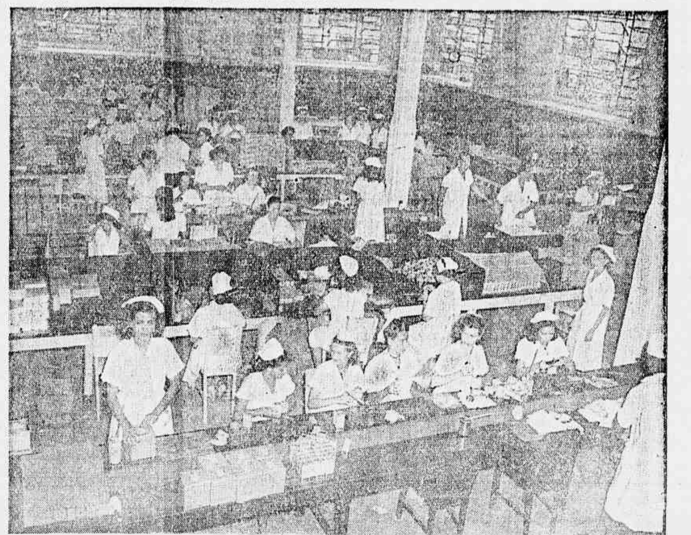
Viz um aspecto da secção de Embalagem e Acondicionamento dos Laboratórios Moura Brasil - Orlando Rangel S. A.