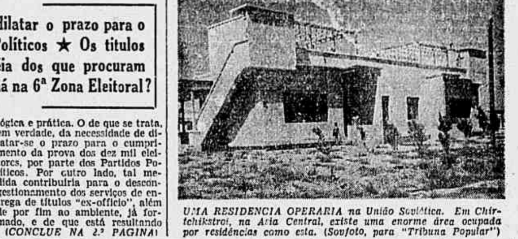
UMA RESIDENCIA OPERARIA na União Soviética. Em Chirchik, na Ásia Central, existe uma enorme área ocupada por residências como esta.

Calles, depois de terminar sua instrução e mescolas publicas tornou-se professor e durante 16 anos ensinou na escola de seu estado natal. Posteriormente, Calles abriu uma casa comercial, à frente da qual esteve até 1913, quando ingressou como sol-