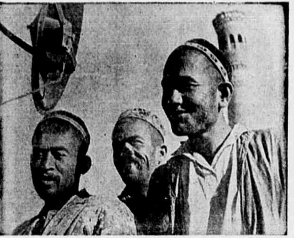
Como Estado multi-nacional, a União Soviética é aclamada por um grande número de povos que vivem fraternalmente em suas diferentes repúblicas. Aparecem no clichê ao alto, camponeses "kolhozianos" da República do Uzbequistão.

Em tom de esta deliberação do T. S. E. será inteiramente justa,