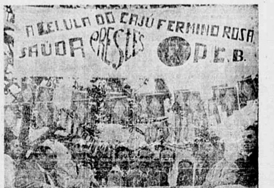
Luiz Carlos Prestes, ao pronunciar seu discurso. Em baixo, parte da assistência presente ao comício.