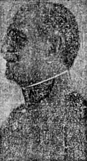
General Tasso Fragoso

Em palestra na redação da TRIBUNA POPULAR, o líder popular sr. Marcos Zeida pinta, com cores vivas, o panorama político da sua terra