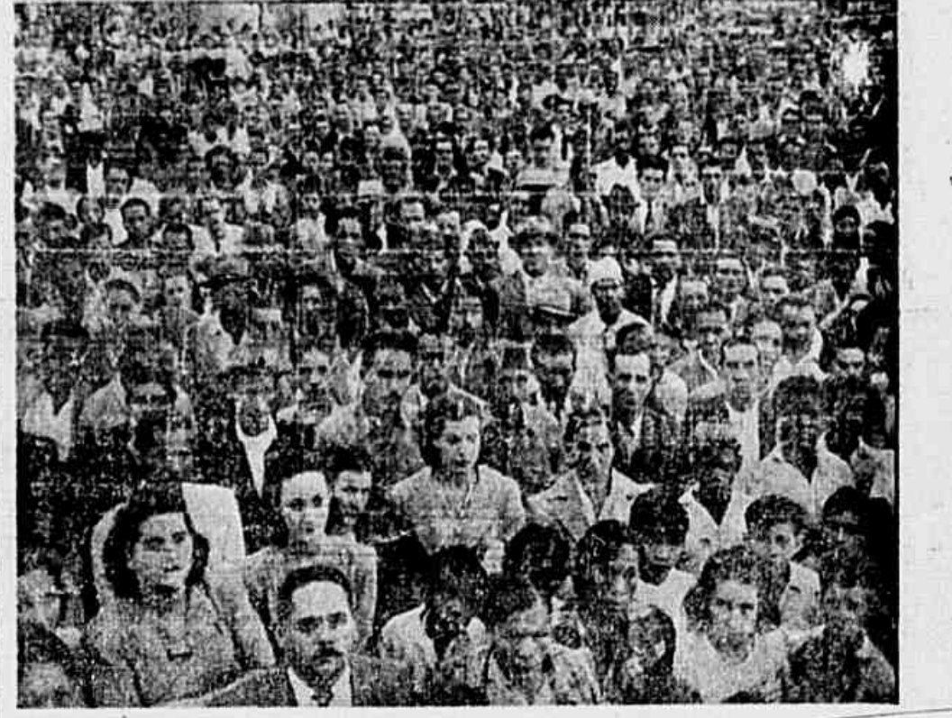
Em alto, Prestes, ao pronunciar seu discurso. Em baixo, parte da assistência presente ao comício.