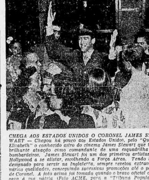
CHEGA AOS ESTADOS UNIDOS O CORONEL JAMES STEWART — Chegou há pouco aos Estados Unidos, pelo "Queen Elizabeth", o conhecido astro do cinema James Stewart que festejará amanhã como comandante de uma esquadra de bombardeiros. James Stewart foi um dos primeiros artistas de Hollywood a se alistar, escolhendo a Força Aérea. Tendo sido designado para servir na Inglaterra, sempre revelou extraordinárias qualidades, conseguindo sucessivas promoções até o posto de Coronel. A foto acima foi tomada quando o bravo oficial chegou a sua pátria