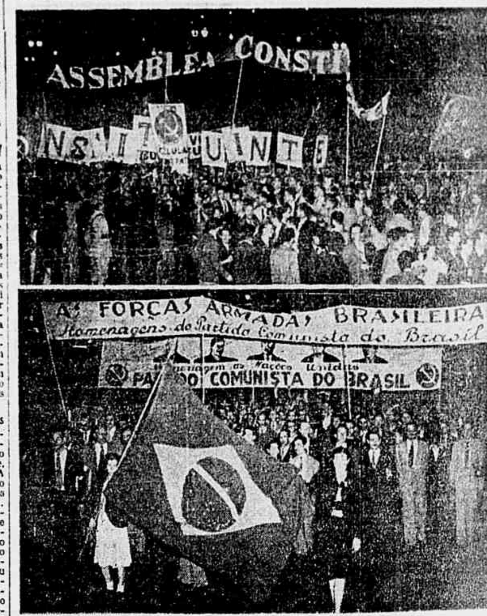
Durante os festejos da Semana da Pátria, os trabalhadores e o povo de São Paulo, mobilizados pelo Partido Comunista, saíram à rua em manifestação para a convocação da Constituinte