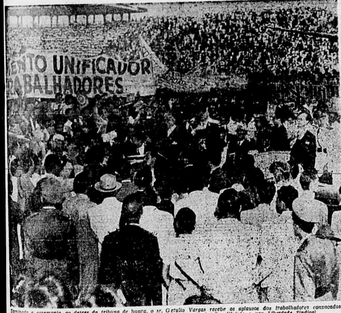
Terminada a cerimonia, ao descer da tribuna de honra, o sr. Getúlio Vargas recebe os aplausos dos trabalhadores convocados pelo MUT, que cercaram o seu carro, clamando pela convocação da Constituinte e por Liberdade Sindical

TRABALHADORES ORGANIZADOS FESTEJAM O DIA DA PATRIA