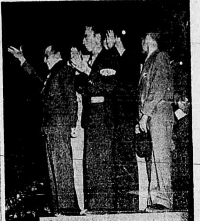
De uma das escadarias do Viaduto do Chá, Prestes assiste o desfile em companhia dos membros dos Comitês Estadual e Nacional do PCB

Já o sr. Getúlio Vargas havia iniciado o seu discurso, quando chegou ao estádio de São Januário, composta de dezenas de milhares de pessoas, a gigantesca delegação de trabalhadores sob a direção do Movimento Unificador dos Trabalhadores, sendo alvo de grandes aplausos por parte da assistência.