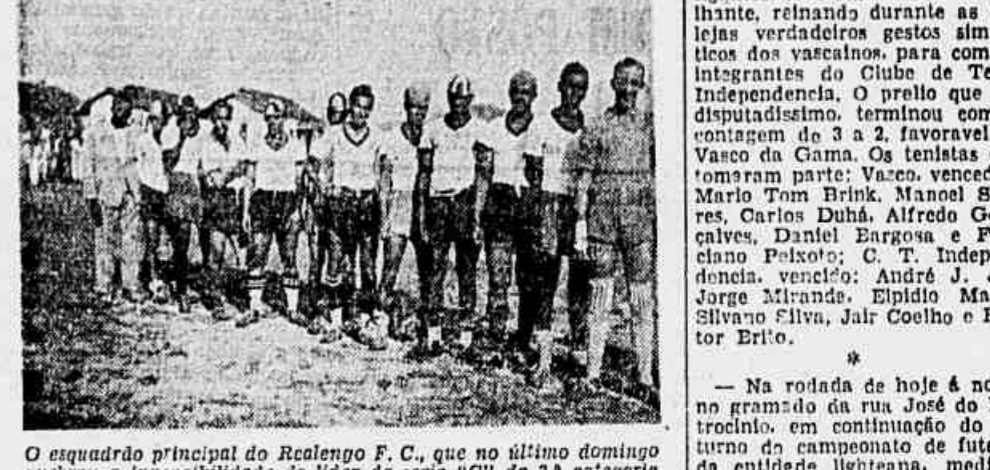
O esquadro principal do Realengo F. C., que no último domingo quebrou a invencibilidade do líder da serie "C" da 3.ª categoria

Argentino x Piedade e União x Brasil Novo os preliminares de hoje — Colocação dos concorrentes do certame da terceira categoria — Regozija-se o Realengo F. C. pela vitória obtida sobre o Guanabara — Outras notas