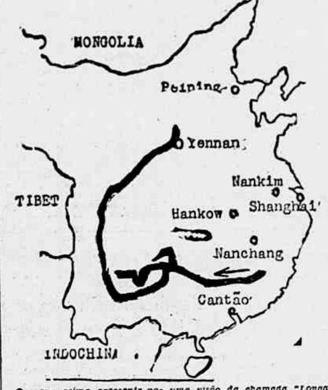
O mapa acima apresenta-nos uma visão da chamada "Linha Marchal" em que Mao-Tse-Tung e Shou-Teh, à frente das tropas comunistas, cobriram 10.000 quilômetros do território chinês, acossados pelos soldados de Chiang-Kai-Shek. A grande travessia das Sete Cordilheiras que se iniciou em Outubro de 1934, terminou em Novembro de 1935, quando os comunistas se estabeleceram nas províncias de Shensi e Shansi, onde, com indomável energia, edificaram uma florescente República Soviética

RUMANIA — A rádio de Bucarest informa que foi descoberto, ontem, um complot terrorista na Rumania para depor o atual governo. O general Radescu era o chefe do complot. Foram encontrados material de propaganda e manifestos na sede do jornal terrorista "Vapala", nos quais se incluíam o povo a atos terroristas contra o ministro de Estado, entre eles o chefe do governo, sr. Groza. Todos os implicados no complot foram detidos pela polícia e confessoram francamente o planejamento da desordem. — (U. P.).