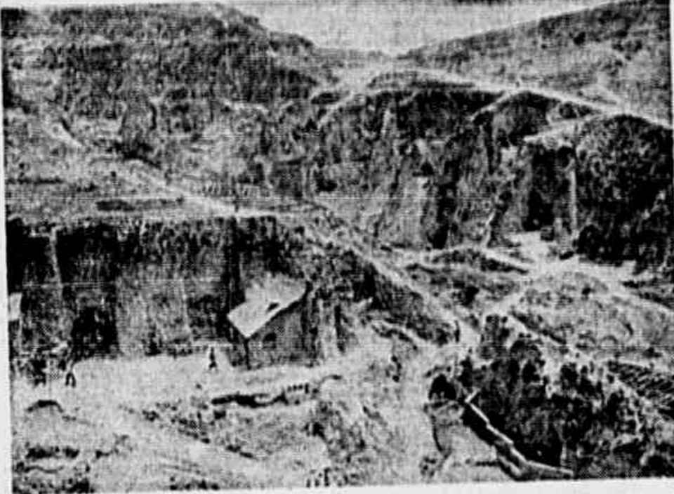
Éis aí como vivem no noroeste da China, onde tem base o 8.º Exército Comunista, milhões de patriotas chineses. Suas habitações são cavadas na pedra, tendo as encostas das montanhas como defesa natural contra as incursões aéreas. Foi-se adaptando habilmente às condições do terreno, e Mao Shou conseguiu levar suas tropas à longínqua região da Ásia Central, a fim de estabelecer os duplos ataques de Chiang e dos japoneses e mais tarde entrarem em ofensiva contra os invasores da sua Pátria, embora as mil dificuldades antecipadas pelo governo de Kai-Shek

UMA EPOPEIA QUE HONRA UM POVO E UMA REPÚBLICA — PROESA IGUAL A DA COLUNA PRESTES, CUJA TRAJETÓRIA COBRE O MAPA DE TODO O BRASIL