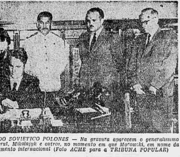
A ASSINATURA DO TRATADO SOVIETICO POLONÊS — Na gravura aparecem o generalissimo Stalin, Molotov, Vashinsky, Bierut, Mikolajczyk e outros, no momento em que MacArthur, em nome da Polônia, assina o documento internacional