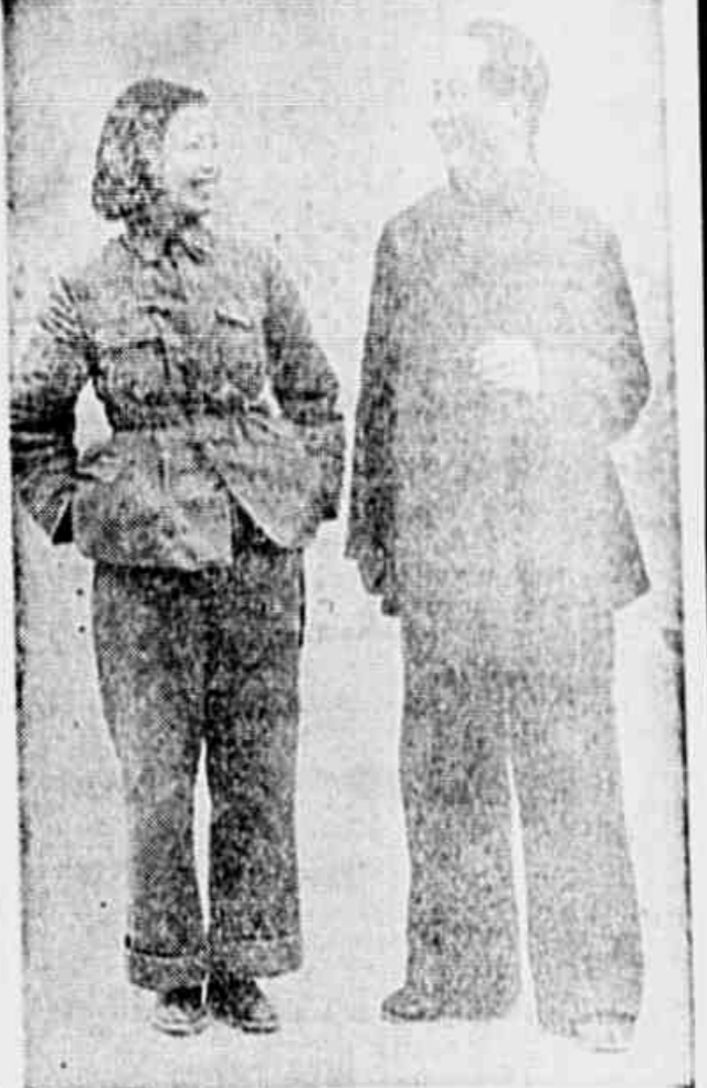
Mao Tse-Tung, que junto com o general Shao-Teh dirige a marcha do Exército Vermelho da China através do Sudoeste, é reconhecido mundialmente como um chefe político e militar. Ocupa as cadeiras jantares do primeiro lugar do Partido Comunista Chinês, que por se trata de uma organização de luta em defesa da unificação do país, da democracia e do progresso. Mao aparece ao lado de sua esposa, Lan Ping, antiga atriz de Shanghai

a guerra contra as forças japonesas no vale do Yangtze com os seus próprios recursos. Não temos a situação destas Exércitos comunistas. Não têm contacto com o mundo exterior, como os da Chungking. Não têm nenhuma espécie de auxílio estrangeiro, como a força aérea do general Chenault. Estão bloqueados até mesmo dentro da China. Não podem se retirar para território livre, trocando espaço por tempo. As suas costas estão as anãs das casamatas e divisões de tropas bem treinadas de Hu Tsung-Nan. Os seus Exércitos tiveram de crescer com dificuldade em territórios arrancados aos japoneses, como o Marechal Tito o fez nas áreas arrancadas aos alemães na Iugoslávia.