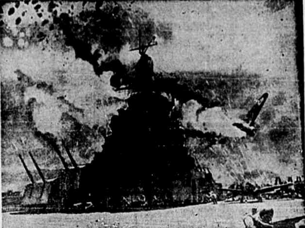
UM AVIAO SUICIDA japonês tenta fogar-se, com sua carga de bombas, na pista de um porta-aviões americano. Entretanto o fogo anti-aéreo do barco faz explodir o "kamikaze" ainda no ar, frustrando a fanática tentativa.

Varias cidades e pontos fortificados nipônicos foram tomados de assalto — Comunicado do alto comando da U.R.S.S. — Ativa, a Força Aérea do Exército Vermelho fustiga objetivos