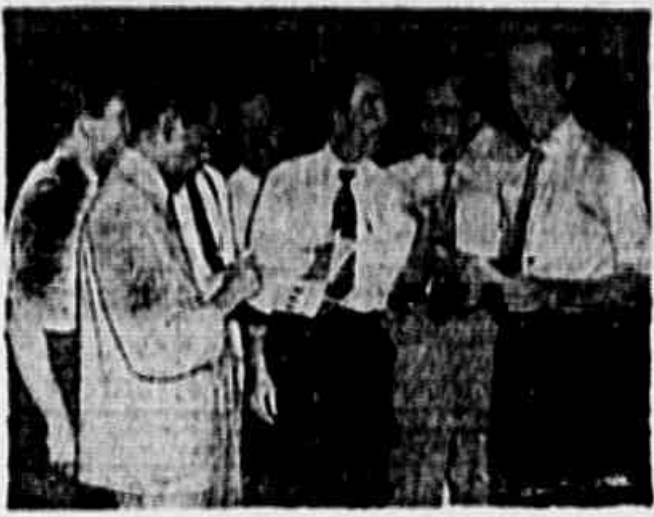
Comerciantes falam sobre o dissídio coletivo