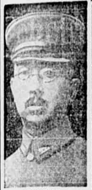
Hirohito e sua divindade

A guerra, porem, continua em terra, no mar e no ar — segundo indicação da Casa Branca