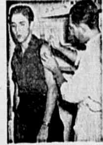
Um jovem morador de Copacabana, no Posto de Emergência anti-gripal, feita na sede do Comitê Democrático de Copacabana, pela Comissão Médica do mesmo

ANO I Rio de Janeiro, Sábado, 11 de Agosto de 1945