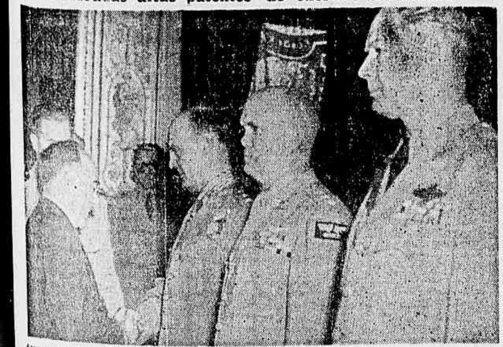
Aspecto colhido por ocasião da cerimônia de condecoração dos oficiais aviadores norte-americanos

FRANCO anda á procura de um "sangue-azul" que possa substituí-lo com a restauração da monarquia na Espanha. Mas a sua situação está de tal maneira comprometida que o próprio príncipe João Carlos de Bourbon e Battenberg, que se considera herdeiro do trono depois que seu irmão mais velho, o falecido príncipe das Astúrias, foi declarado incapaz, e outro descendente do príncipe Jaime, desistiu dos seus direitos.