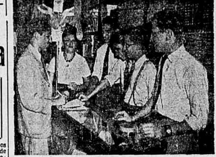
Num armazinho rapazes manifestam seu bom humor e sua confiança na vitória

Segundo informação que chegamos na sede do Partido Comunista, acaba de ser convidado o escritor Monteiro Lobato para figurar na chapa do Partido Comunista do Brasil