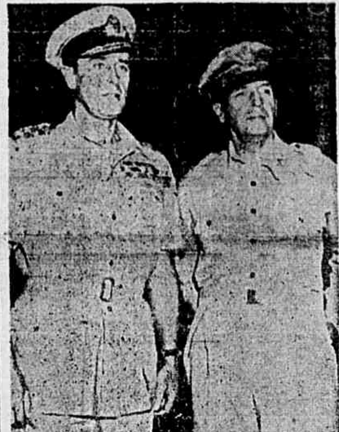
Estas são as mais recentes fotografias dos dois comandantes supremos britânico e norte-americano no Pacífico, o Almirante Lord Mountbatten e o general Douglas Mac Arthur.

AO LONGO DOS RIOS E LINHAS FERREAS — LONDRES, 10 (U. P.) — A nova investida das forças soviéticas no Extremo-Oriente, na região do rio Amur, foi levada a efeito duzentas e noventa