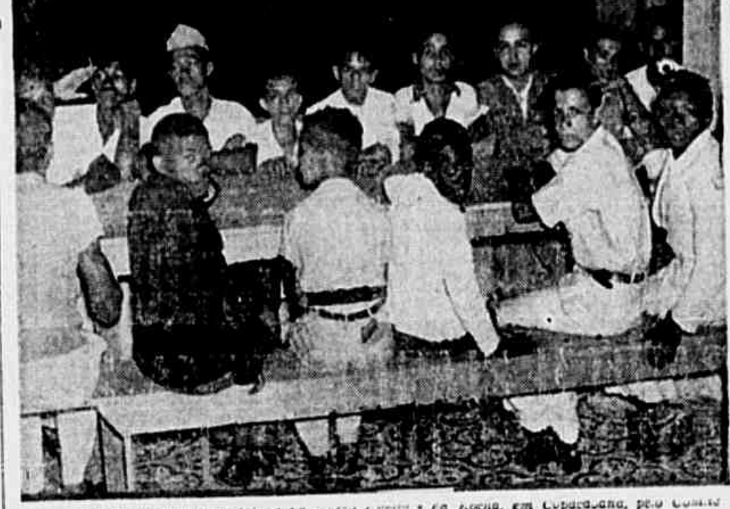
Alunos da escola noturna instalada no Morro Euclides da Rocha, em Copacabana, pelo Comitê Democrático de Copacabana.