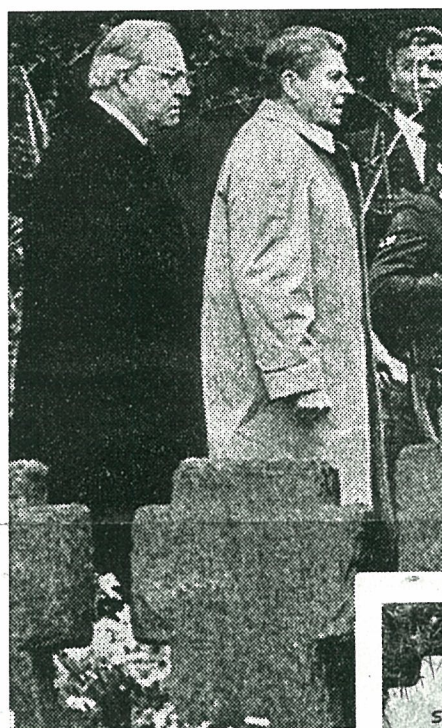
Kohl und Reagan am 5. Mai in Bitburg

Am Vortag hatte die westdeutsche Polizei im Morgengrauen 35 französische antifaschistische Widerstandskämpfer und Überlebende der Konzentrationslager festgenommen;