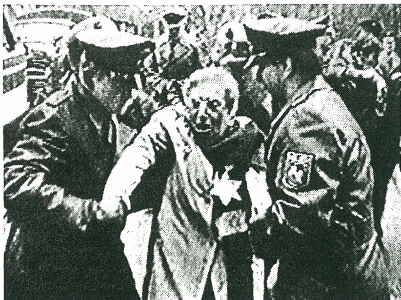
Deutsche Polizisten machen Bergen-Belsen „judenfrei“

Das Ganze begann sogar noch vor dem offiziellen Beginn des Kalten Kriegs, in den allerletzten Tagen des Zweiten Weltkriegs, als der US-Geheimdienst Mitgliedern der SS-Einsatzgruppen und osteuropäischen Nazis, die tausende Juden, Zigeuner, Kommunisten und andere an der Ostfront abgeschlachtet hatten, Straffreiheit anbot. Alexander Cockburn wies im Wall Street Journal (2.