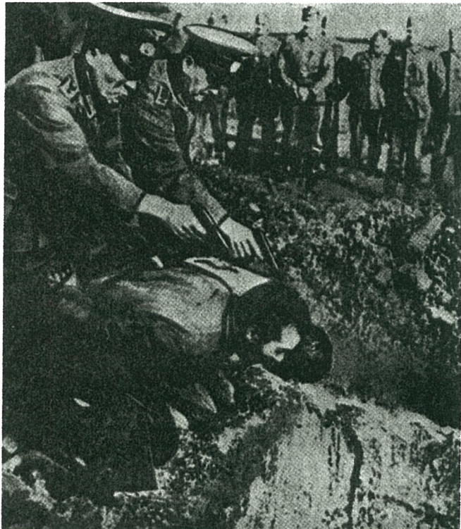
SS-Einsatzgruppe ermordet sowjetische Bauern. Erst die siegreiche Rote Armee setzte dem faschistischen Terror ein Ende

Mai) darauf hin, daß für Reagan „das Datum des 8. Mai 1945 den Zeitpunkt zu repräsentieren scheint, an dem die Russen endlich durch die Amerikaner, die Briten und die guten Deutschen an der Elbe gestoppt wurden.“ Und was die SS-Leute betrifft, die an dem Massaker an 86 amerikanischen Kriegsgefangenen in Malmédy beteiligt waren – Reagans Männer wollten sich angeblich gerade darum besonders gekümmert haben –, so weist Cockburn darauf hin, daß die 73 Mitglieder des Ersten Panzerkorps, die die USA wegen dieses Massakers vor Gericht stellten, im wesentlichen ungeschoren davorkamen – keiner wurde hingerichtet –, und zwar als direkte Auswirkung des Drucks des Kalten Kriegs, auch seitens des US-Senators Joseph McCarthy!