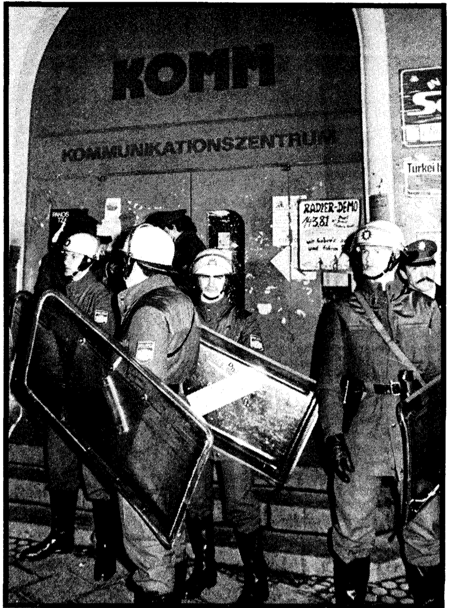
Nürnberg, 5. März: Polizei organisiert „größte Massenverhaftung seit dem Ende des Dritten Reichs“ (Der Spiegel)

ten!“ Wer soll hier wen „amnestieren“? Garski die Hausbesetzer? Aus der richtigen Lösung: „Eins, zwei, drei – laßt die Leute frei!“, für die Zehntausende mobilisiert wurden, wird nun eine Bitte nach „Haftverschonung“ und die Forderung nach einem „Straffreiheitsgesetz“. Auf einer Veranstaltung des Aktionskomitees für Amnestie am 20. März in Westberlin wurden Unterstützer des Hungerstreiks der RAF, die zu dem lebensbedrohlichen Zustand der verhafteten Gabriele Fortgesetzt auf Seite 10