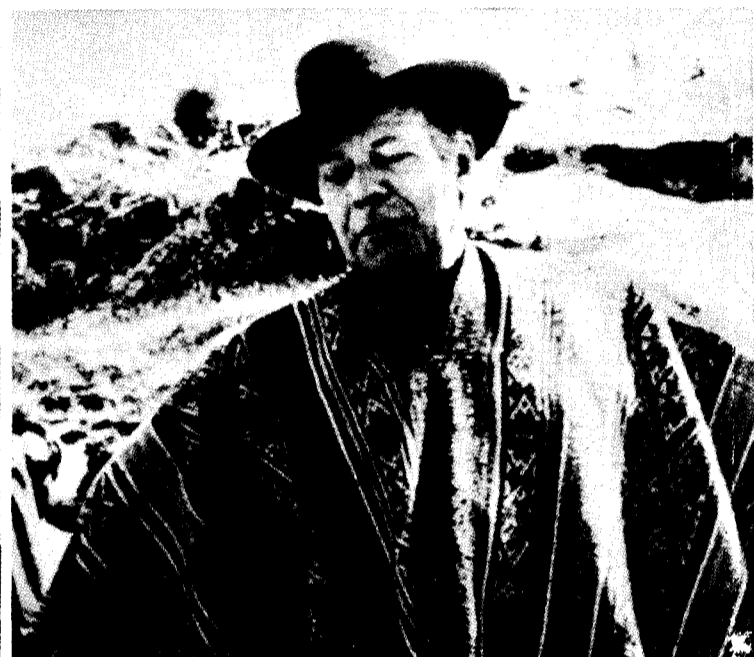
Brandt und Schmidt: Feinde der lateinamerikanischen Revolution

FDR (angeführt von Ungo, gleichzeitig einer der Vizepräsidenten der SI) ausgesprochen. Am 5. Februar erklärte er in einer Auseinandersetzung mit der CDU, das Programm der FDR (die in Reagans Augen lediglich eine Art größerer „Baader-Meinhof-Bande“ auf zentralamerikanischem Boden darstellt) „scheint der SPD eine Grundlage dafür zu sein, daß das Land zum Frieden zurückfinden kann“ (FAZ, 6. Februar). Es ist ein offenes Geheimnis, daß die SPD über die Sozialistische Internationale den salvadorianischen Aufständischen massive Geldsummen hat zukommen lassen, die diese wiederum in Maschinenpistolen und Panzerfäusten anlegen. Und zur gleichen Zeit, wo Reagan die von Carter bewilligte Finanzhilfe für Nicaragua stornierte, erklärte das sozial-liberale Bonner Kabinett, das der „Revolutionären Regierung“ in Managua seit dem Sturz Somozas bereits mehr als 97 Millionen Mark hat zukommen lassen, Nicaragua weiterhin unterstützen zu wollen. Den schlechten Beziehungen zwischen Bonn und Washington, bemerkt zähneknirschend die Business Week (12. Januar), „wird durch die Hilfe, die linken Aufständischen in Zentralamerika durch Kanzler Schmidts Sozialisten zuteil wird, nicht geholfen werden.“