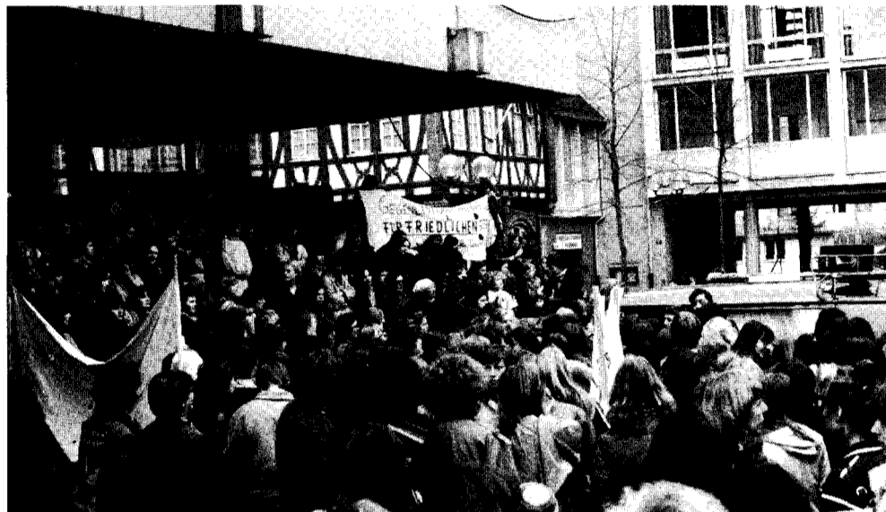
Frankfurt, 7. März: Wallmann verbietet, AsF sekundiert, Frauen marschieren trotzdem. Bild: Kundgebung auf dem Römer

Der Polizeiterror gegen die Frauen war noch nicht beendet. Ihr Tagungshaus, der „Pferdestall“ im Frankfurter Westend, war von der Polizei abgeriegelt, und Besucher mußten sich Kontrollen unterziehen. Zuvor hatte die Polizei Teilnehmer der verbotenen Demonstration zur Unterstützung des Hungerstreiks der RAF trotz ihres Rückzugs brutal auseinandergedrückt und etwa 70 von ihnen verhaftet. Die Demonstranten hatten sich danach im „Pferdestall“ eingefunden, wo