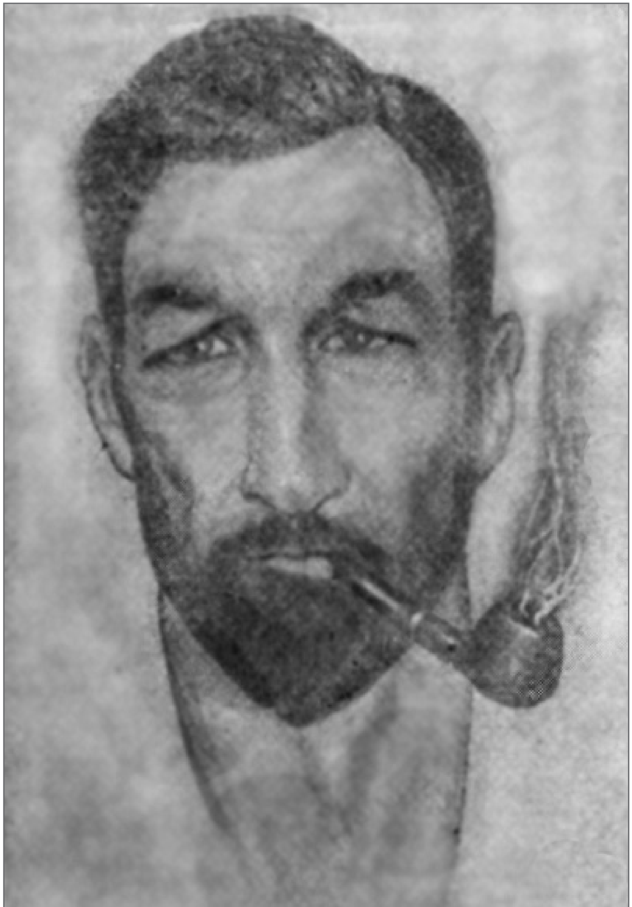
Tristan Marof. Retrato pintado por Cecilio Guzmán de Rojas