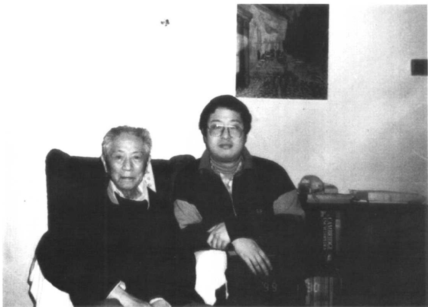
1999年1月与外孙丰丰在里兹寓所