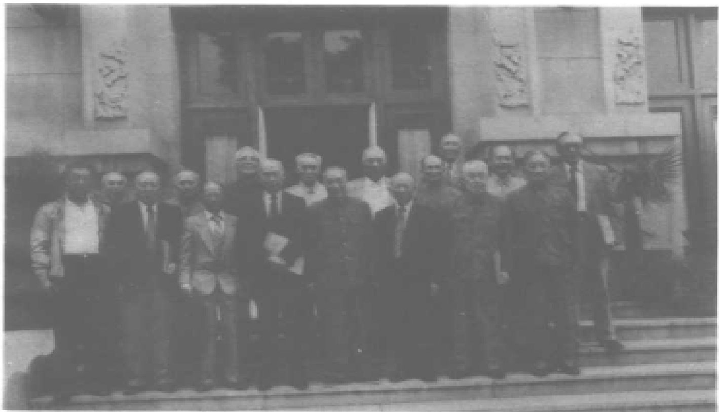
1985年6月16日全国黄埔同学会理事在北京合影