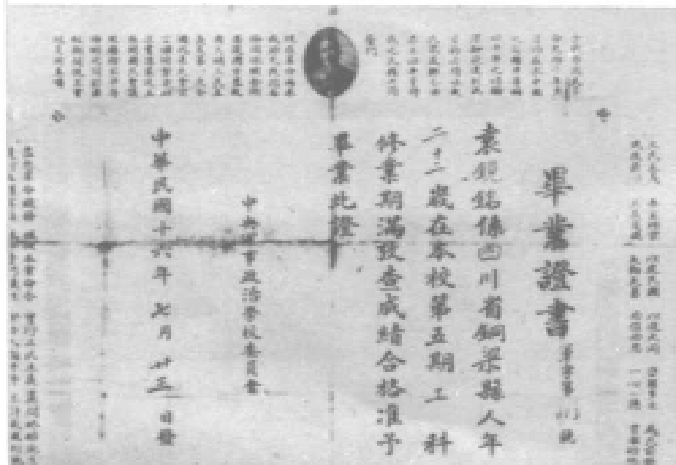
中央军事政治学校毕业证书