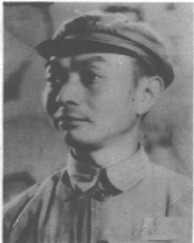
1949年郭汝瑰率部起义