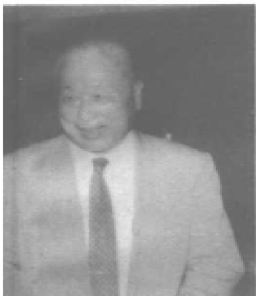
同学温鸣剑将军合影