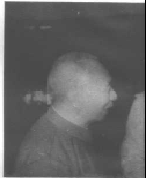
郭汝瑰和黄埔军校老同学