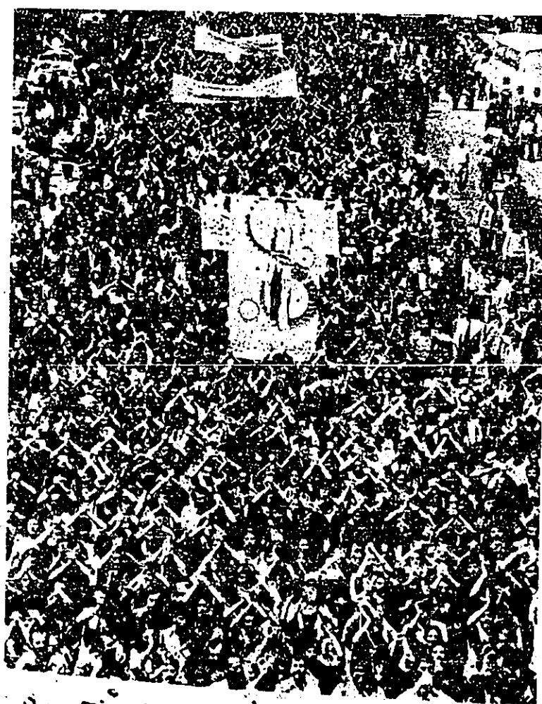
یادداشت در تهران - دیدار اتحاد زنجیرانی (بسم الله الرحمن الرحیم)